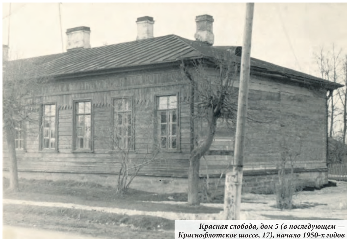
Красная слобода, дом 5 (в последующем — Краснофлотское шоссе, 17), начало 1950-х годов

На Английской аллее Верхнего парка — на «горе», напротив домов 4, 5 и 6 Красной Слободы, росли два больших дерева: сосна и берёза, и на них был на-