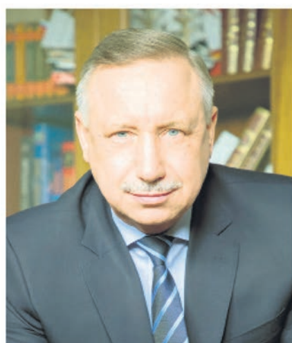
Временно исполняющий обязанности Губернатора Санкт-Петербурга А.Д. Беглов