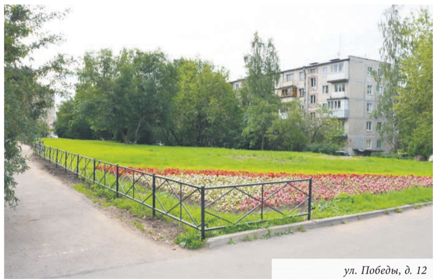
ул. Победы, д. 12

Ольга Михайлова, фото из архива МО г. Ломоносов