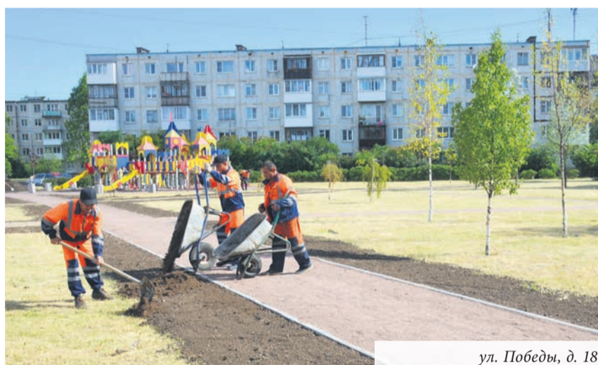
ул. Победы, д. 18