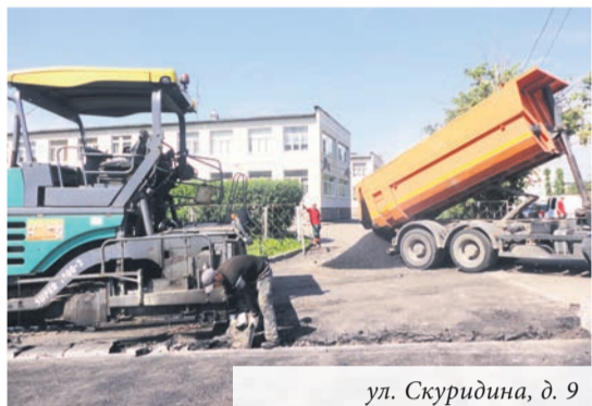
ул. Скуридина, д. 9

В этом году завершены подготовительные работы к масштабному комплексному благоустройству ещё одной городской площадки. Преображение ждёт двор у дома 6 на улице Сафронова. И, поверьте, такого двора в Ломоносове до сих пор не было.