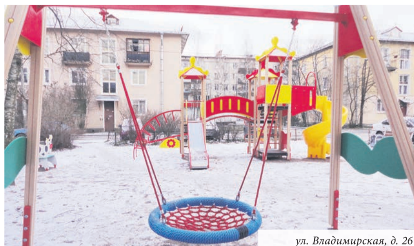
ул. Владимирская, д. 26