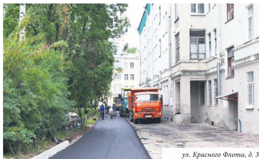
ул. Красного Флота, д. 3