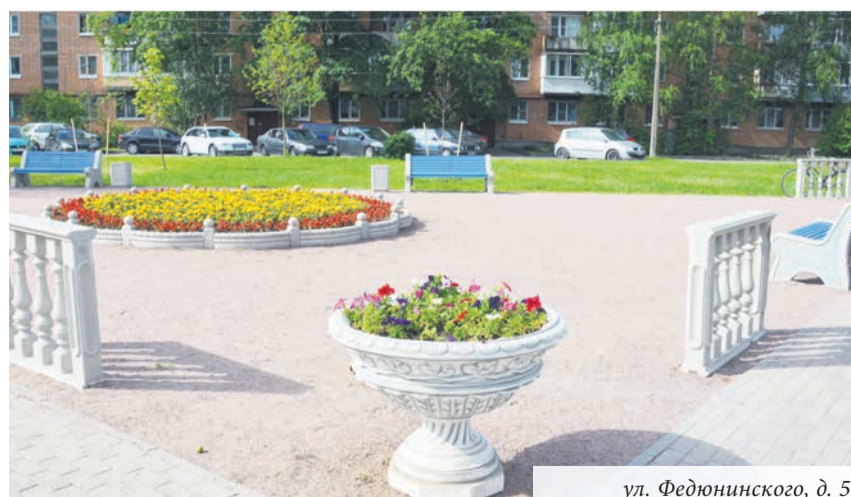
ул. Федюнинского, д. 5