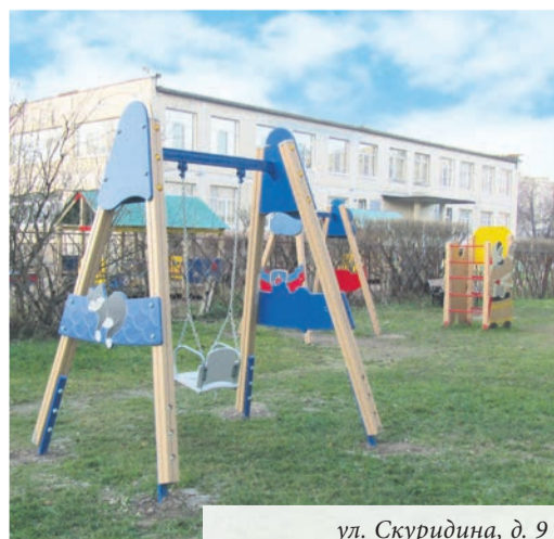
ул. Скуридина, д. 9