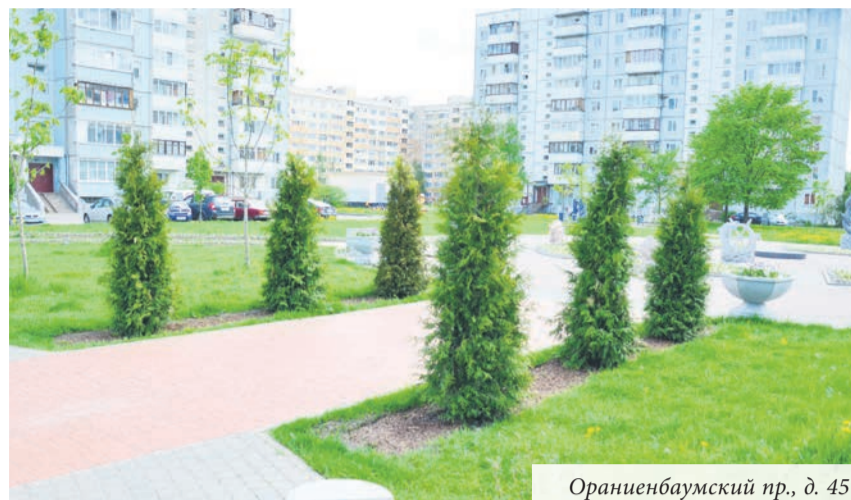
Ораниенбаумский пр., д. 45