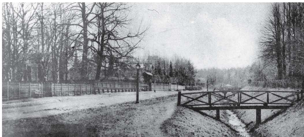
Дореволюционная фотография. Ораниенбаум. Иликовский проспект

Традиция называть города и улицы в честь великих людей, возникшая во второй половине 19-го века, несла в себе чисто мемориальную идею, но прежнее правило давно забыто. Основой советского бытия стала прописка, и вот уже почти 100 лет именны названия у нас дают по признаку «родился», «жил», «бывал». Наиважнейшим стал сам факт проживания знаменитости в городе своего имени или на соименной улице.