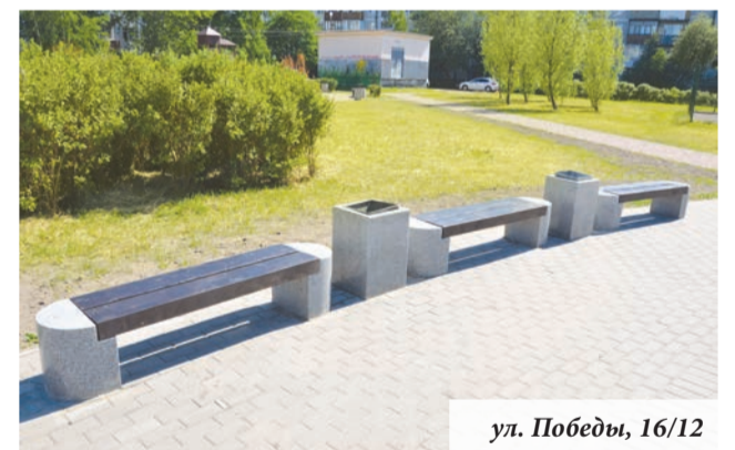
ул. Победы, 16/12