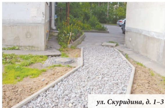
ул. Скуридина, д. 1-3