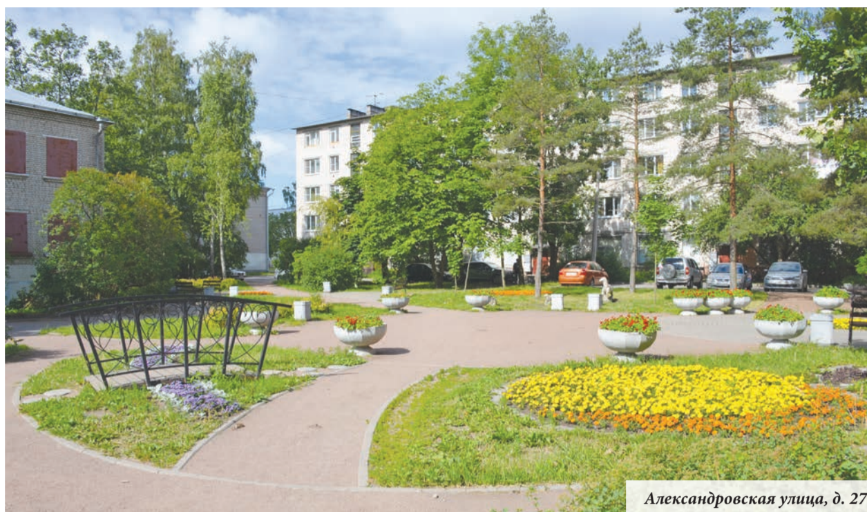
Александровская улица, д. 27