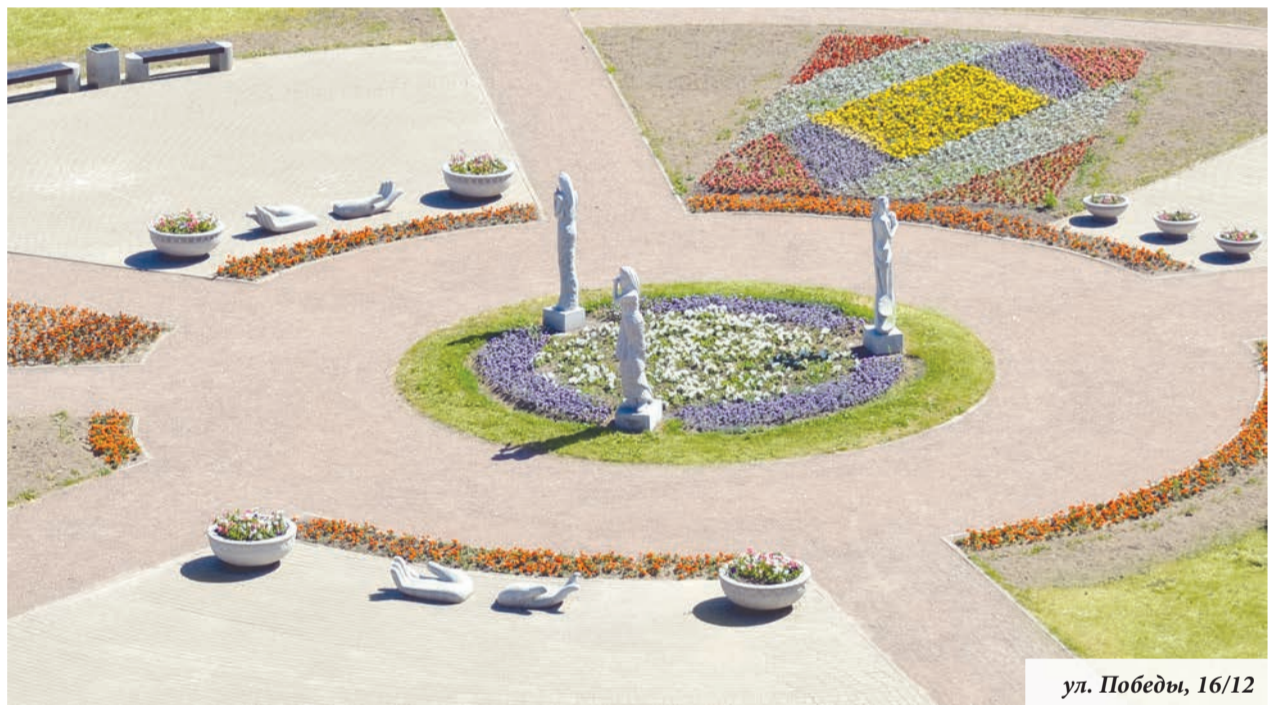
ул. Победы, 16/12