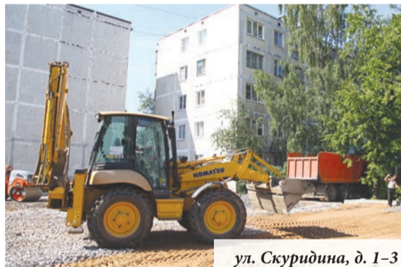
ул. Скуридина, д. 1-3

газон в этом месте постоянно страдал от парковавшихся на нём машин. Газон отремонтировали, поставили ограждение и разбили великолепный цветник.