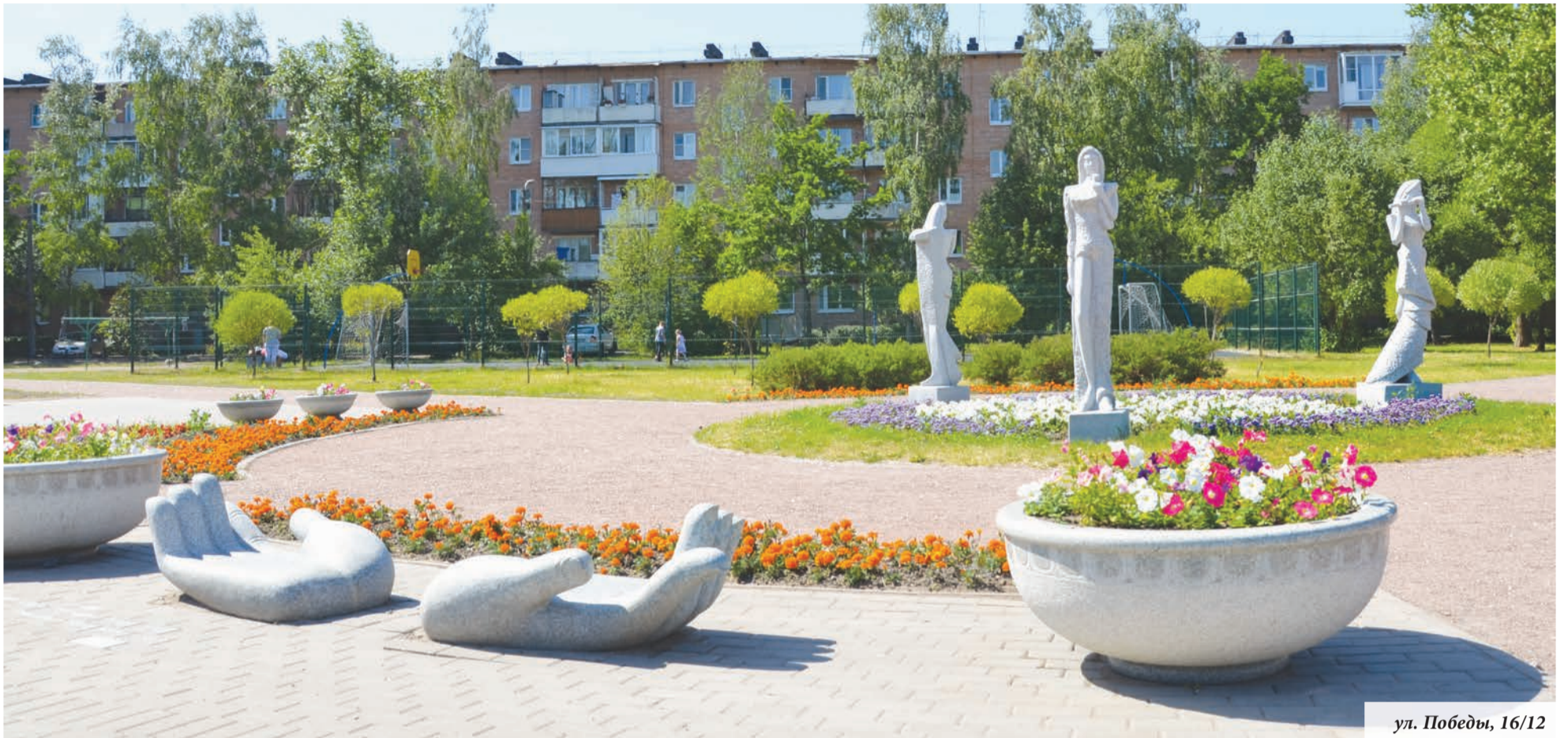
ул. Победы, 16/12

Некоторые неудобства доставляют жителям большие работы по содержанию придомовых и дворовых территорий, выполняемые сегодня по адресам: Красного Флота, 3, 9/46 и 30-а, Сафронова, 4-а, Сафронова, 6, Александровская, 27, Скуридина, 1-3, и Скуридина, 9. Здесь снято асфальтовое покрытие, установлены новые высокие бортовые камни, но неудобства временные, и скоро проведенный ремонт будет только радовать людей.