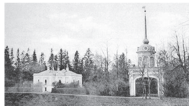
Дворец Петра III. Дореволюционное фото