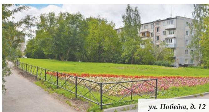
ул. Победы, д. 12

К этой же категории нарушений относится автохлам. Не один год и масса усилий потребовались специалистам, чтобы убрать с улицы Красной несколько больших, оказавшихся никому не нужных автомобилей. На устранение всех этих нарушений, напомним, расходуются бюджетные средства, достойные лучшего применения.