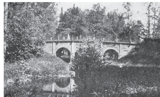
Деревянный Петровский мост. Дореволюционное фото