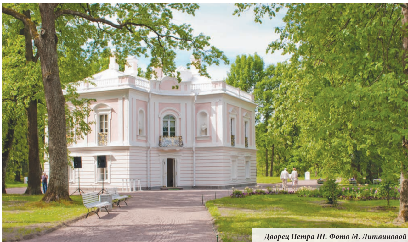
Дворец Петра III.

В мае 2018 года после двухлетней реставрации принял посетителей дворец Петра III. Благодаря этому событию открыт вход в Верхний парк со стороны Александровской улицы, недоступный для горожан и туристов на протяжении двух лет.