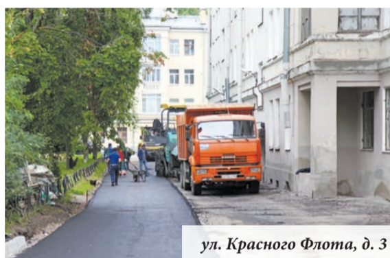
ул. Красного Флота, д. 3