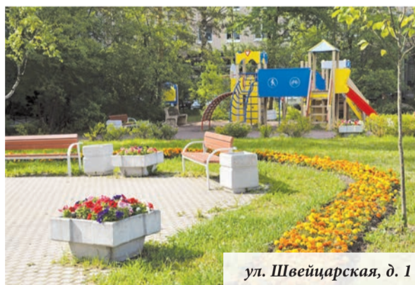
ул. Швейцарская, д. 1