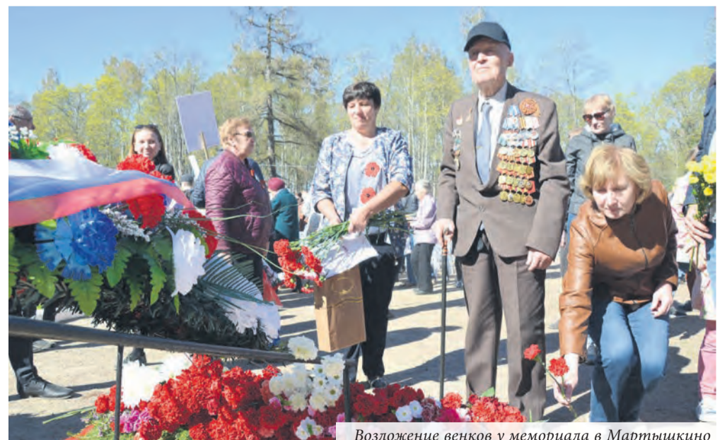
Возложение венков у мемориала в Мартышкино