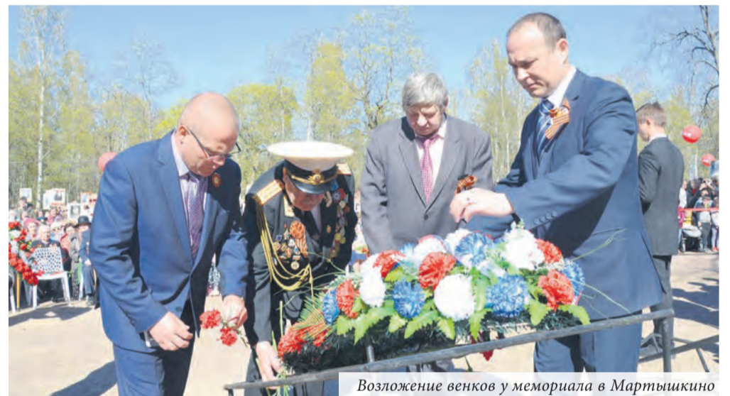
Возложение венков у мемориала в Мартышкино