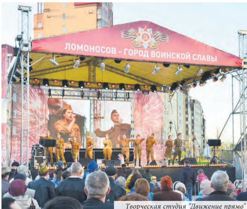
Творческая студия "Движение прямо"

Александра Роцина