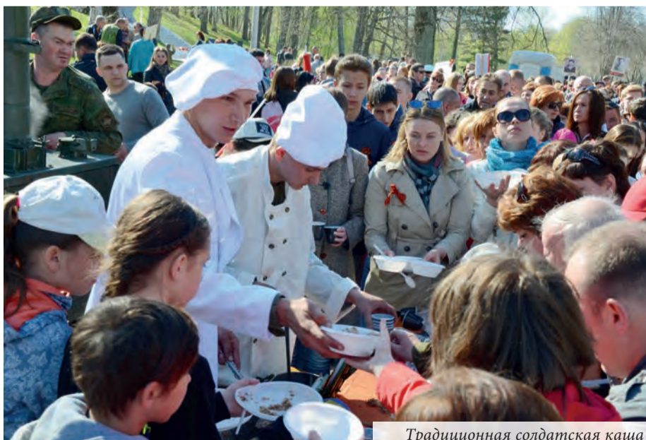
Традиционная солдатская каша