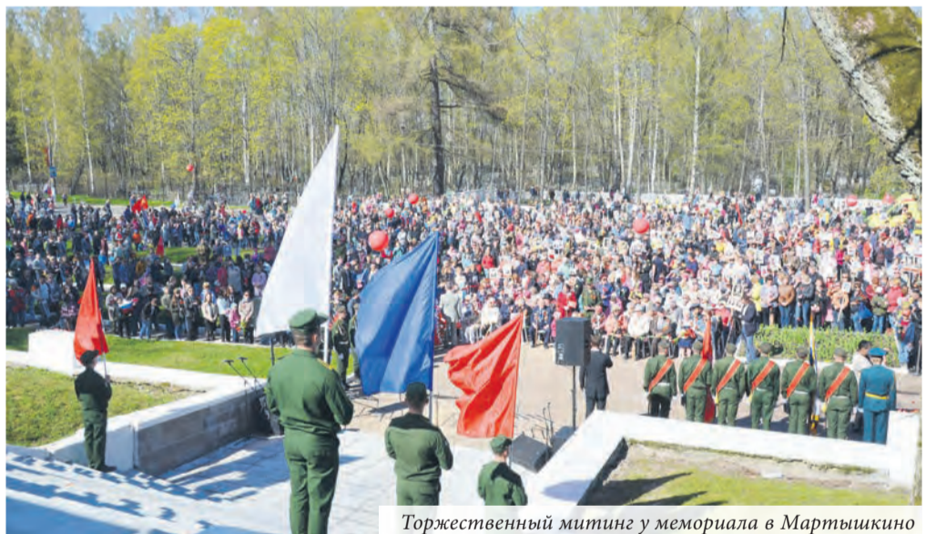
Торжественный митинг у мемориала в Мартышкино