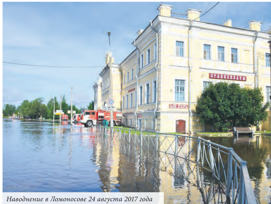
Наводнение в Ломоносове 24 августа 2017 года

Другая проблема - состояние плотины, которая вместе с Красным прудом и водоспусками является историко-ландшафтным объектом, но не имеет этого статуса. Через «мост» над водоспуском непрерывно курсируют автомобили, проезд грузового транспорта не ограничен. Разрушаются гранитные пилоны и каменные ограждения смотровых площадок, кованые решётки заменены примитивными сварными конструкциями. Проводимые «ремонты» не имеют ничего общего с на-