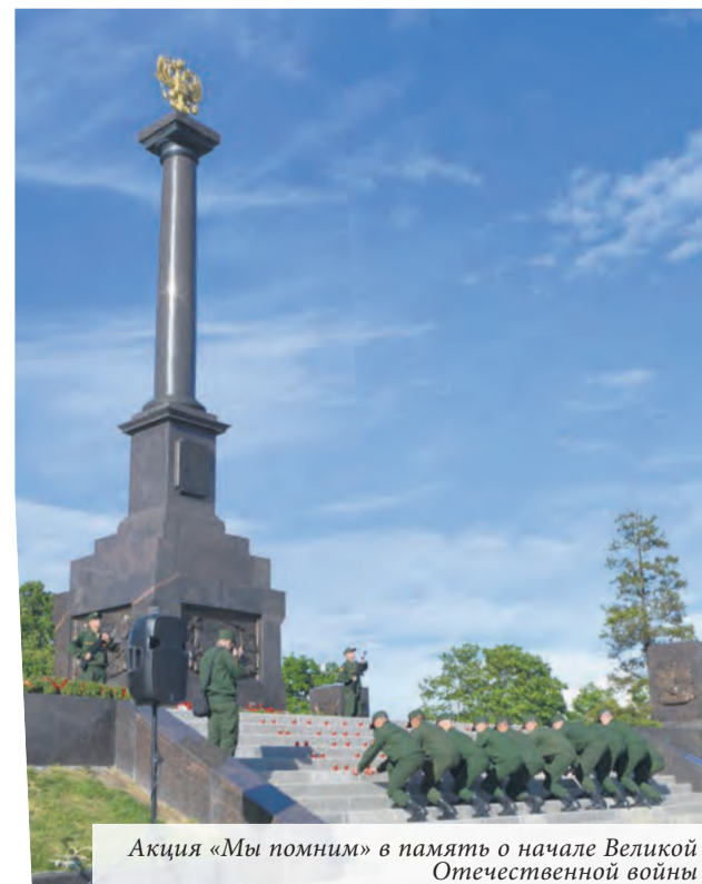
Акция «Мы помним» в память о начале Великой Отечественной войны