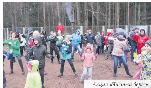
Акция «Чистый берег»