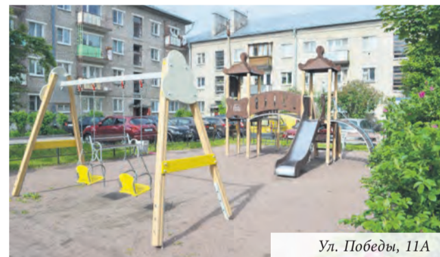
Ул. Победы, 11А

За год на приеме специалистов отдела побывали 286 посетителей. По всем обращениям приняты профессиональные решения. Отвечено на 306 письменных обращений граждан.