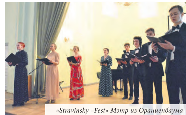
«Stravinsky –Fest» Мэтр из Ораниенбаума

вызвали неподдельный восторг маленьких зрителей. В период весенних и осенних каникул для детей города в Ломоносовском городском доме культуры при финансовой поддержке муниципалитета проходят детские спектакли.