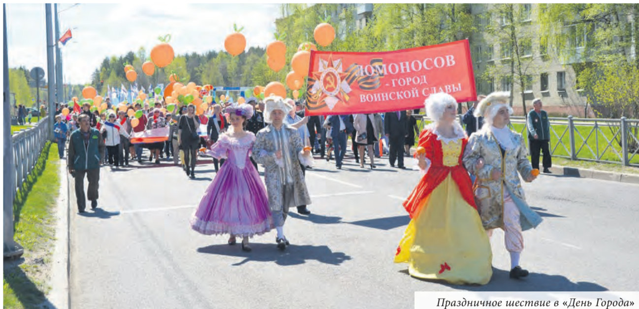
Праздничное шествие в «День Города»