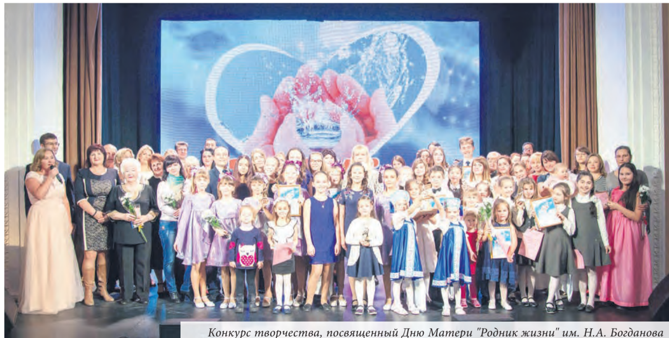
Конкурс творчества, посвященный Дню Матери "Родник жизни" им. Н.А. Богданова

Завершает календарь событий праздничная программа и грандиозный, ослепительный фейерверк, который собирает всех ломоносовцев в новогоднюю ночь на главной площади города.