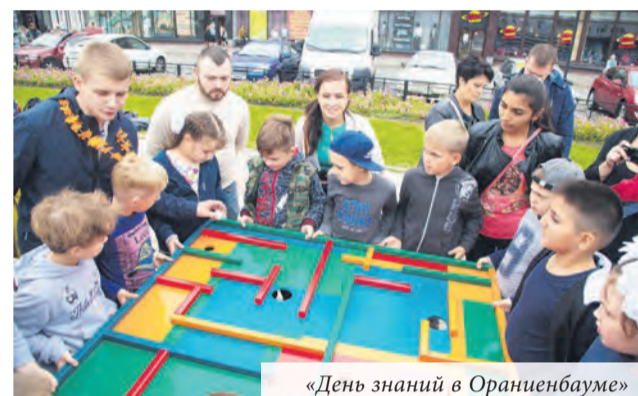
«День знаний в Ораниенбауме»