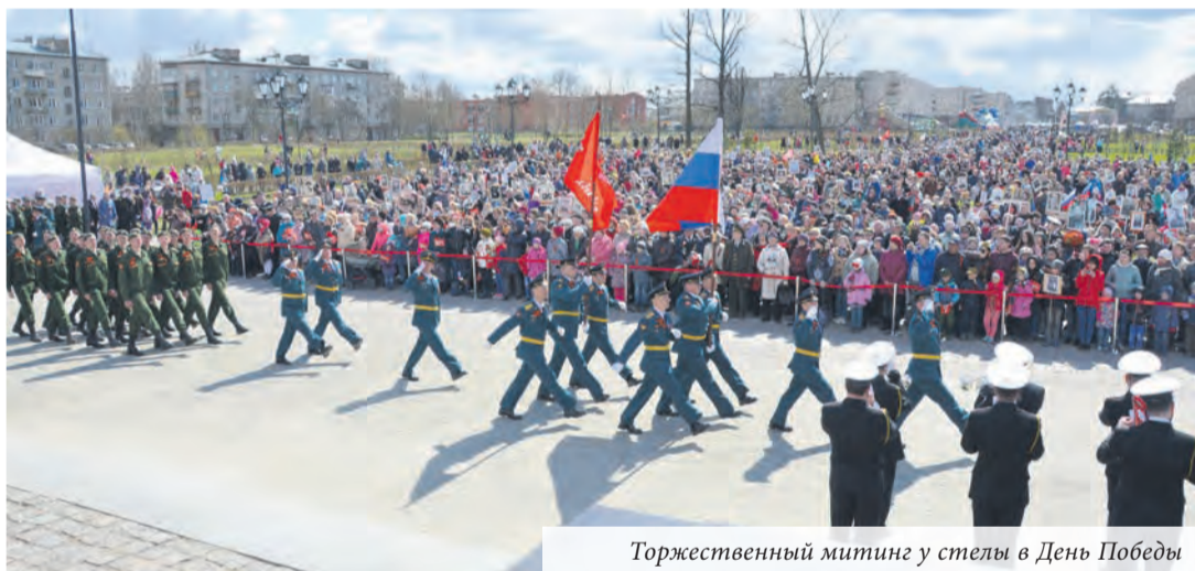
Торжественный митинг у стелы в День Победы

За организацию работ по военно-патриотическому воспитанию в 2017 году муниципальному образованию город Ломоносов присуждено первое место в конкурсе среди внутригородских муниципальных образований Санкт-Петербурга. А в номинации «Лучшее мероприятие» этого конкурса наше «Знамя Победы над Рейхстагом» заняло третье место.