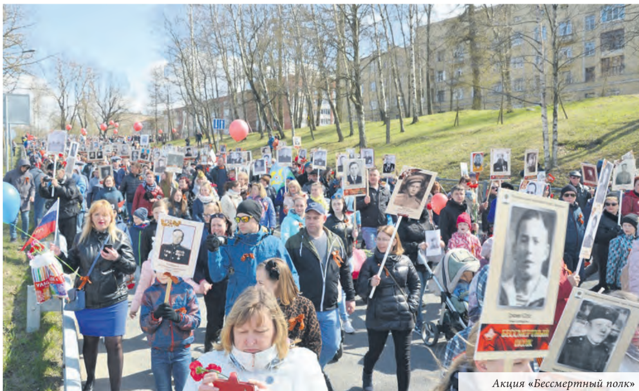
Акция «Бессмертный полк»