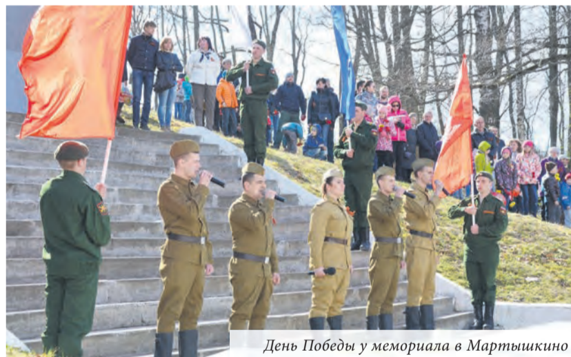
День Победы у мемориала в Мартышкино