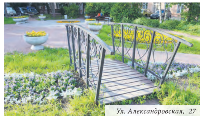
Ул. Александровская, 27