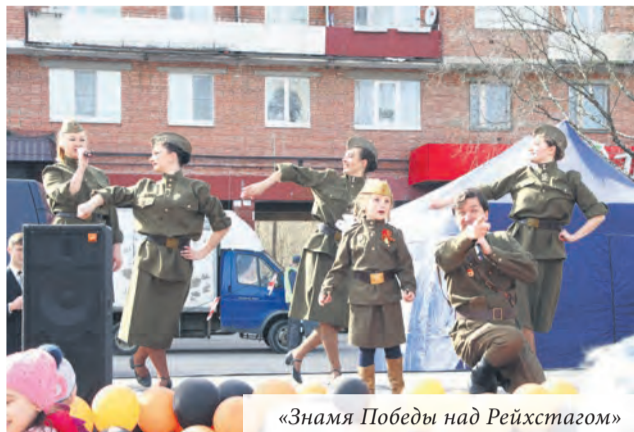
«Знамя Победы над Рейхстагом»