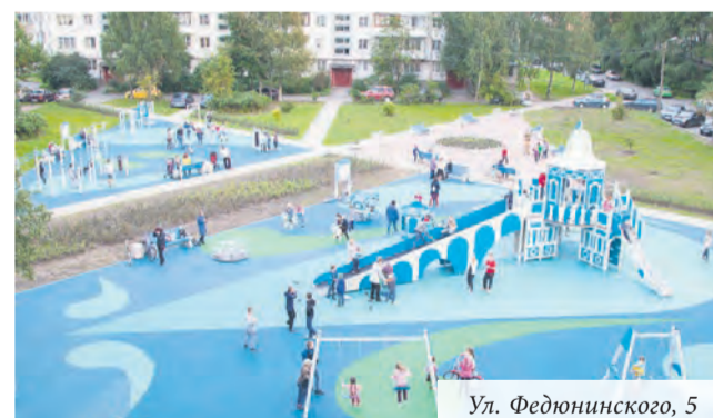
Ул. Федюнинского, 5