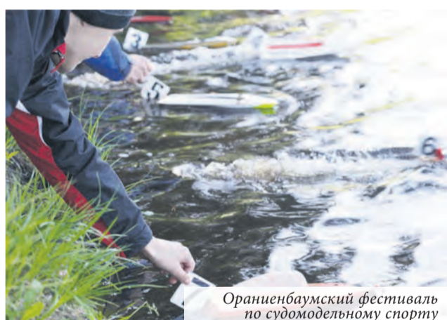
Ораниенбаумский фестиваль по судомодельному спорту

Специалисты местной администрации пропагандируют здоровый образ жизни среди жителей, в том числе личным участием в сдаче норм ГТО.