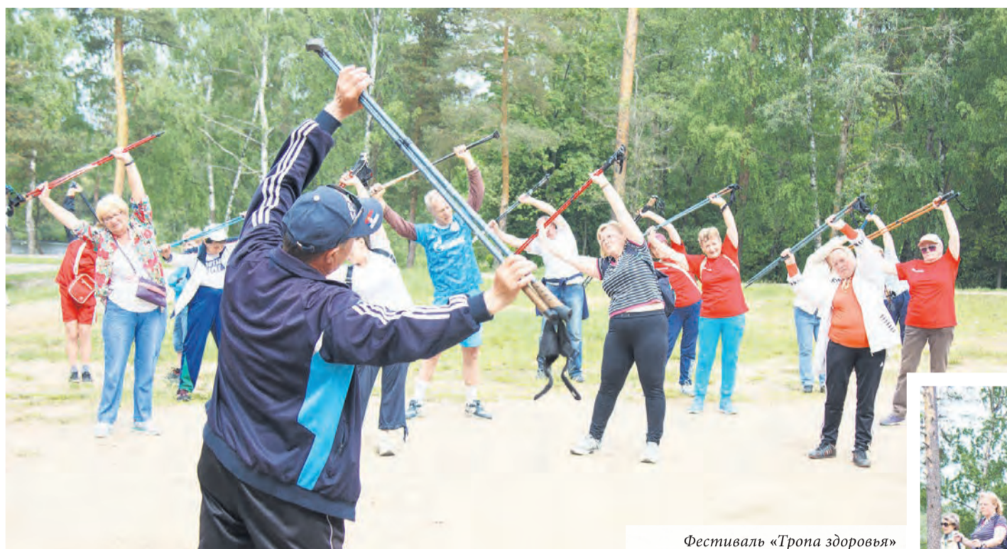
Фестиваль «Тропа здоровья»