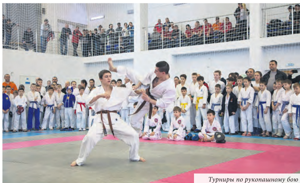
Турниры по рукопашному бою