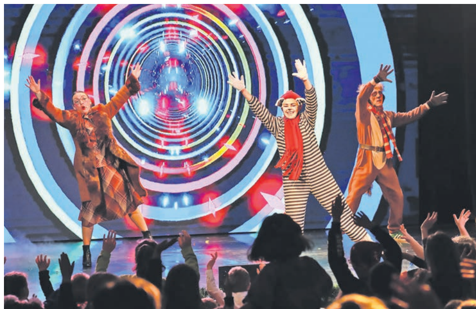
Новогодний спектакль для детей