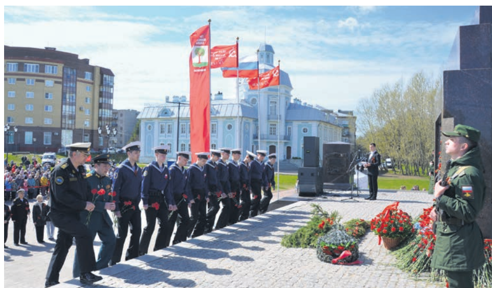
День Победы в Ломоносове