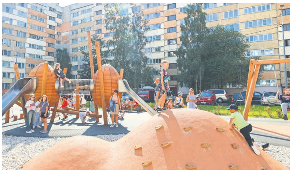
Ораниенбаумский пр., д. 49