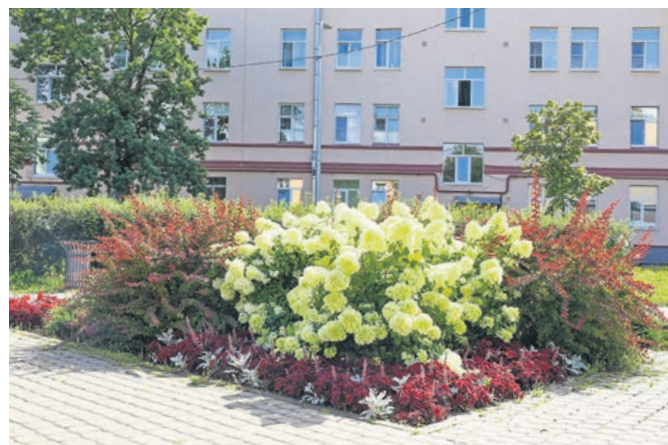
Ул. Сафронова, д. 6