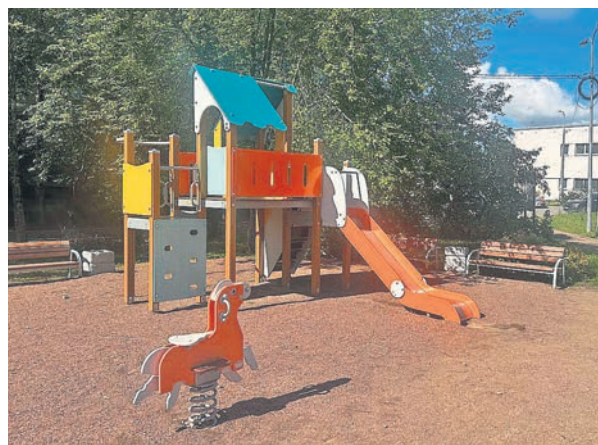
Ул. Швейцарская, д. 1