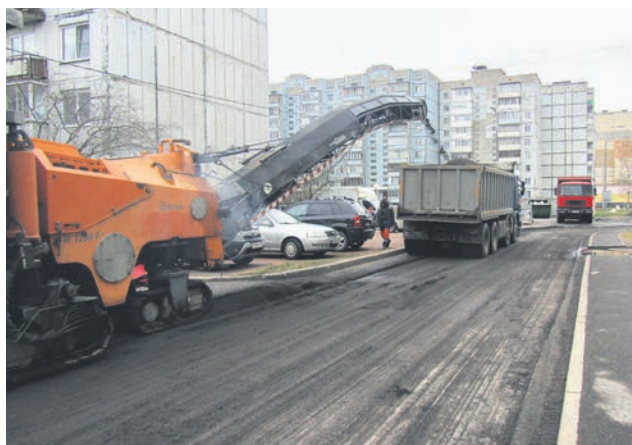
Ул. Победы, д. 36, к. 2