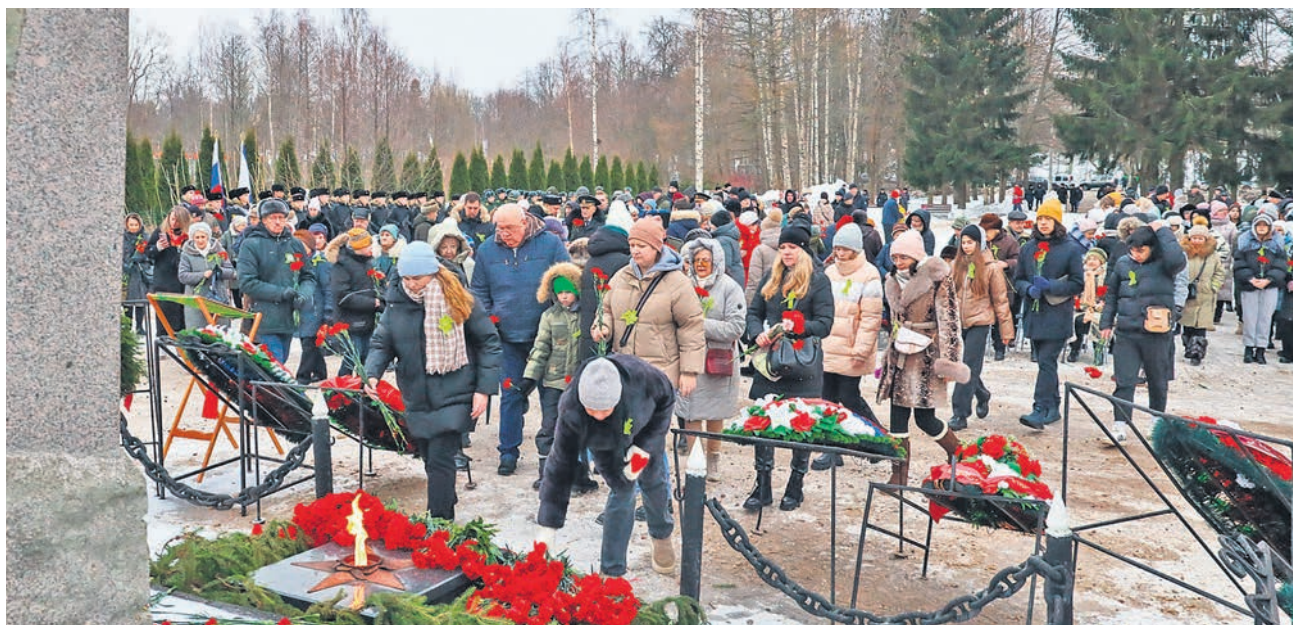
Возложение на Малой Пискаревке 27 января 2024 года