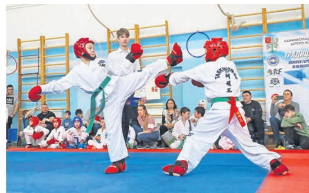
Турнир по тхэквондо