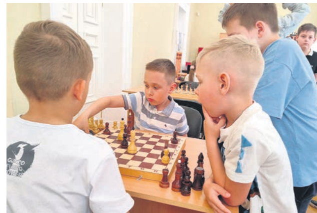
Турнир по шахматам

Ежеквартально проводятся праздники «Я родился на этой земле», на которых чествуют горожан, отметивших 80 и 85-летние Дни рождения. А для самых маленьких ломоносовцев в конце года организуют настоящее чудо – новогодние муниципальные ёлки.