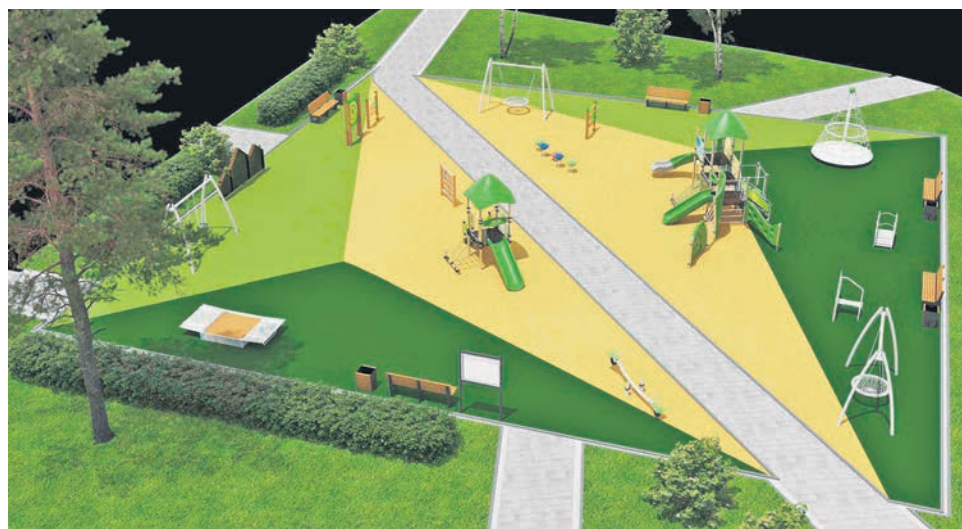
Визуализация проекта на ул. Жоры Антоненко, д. 8