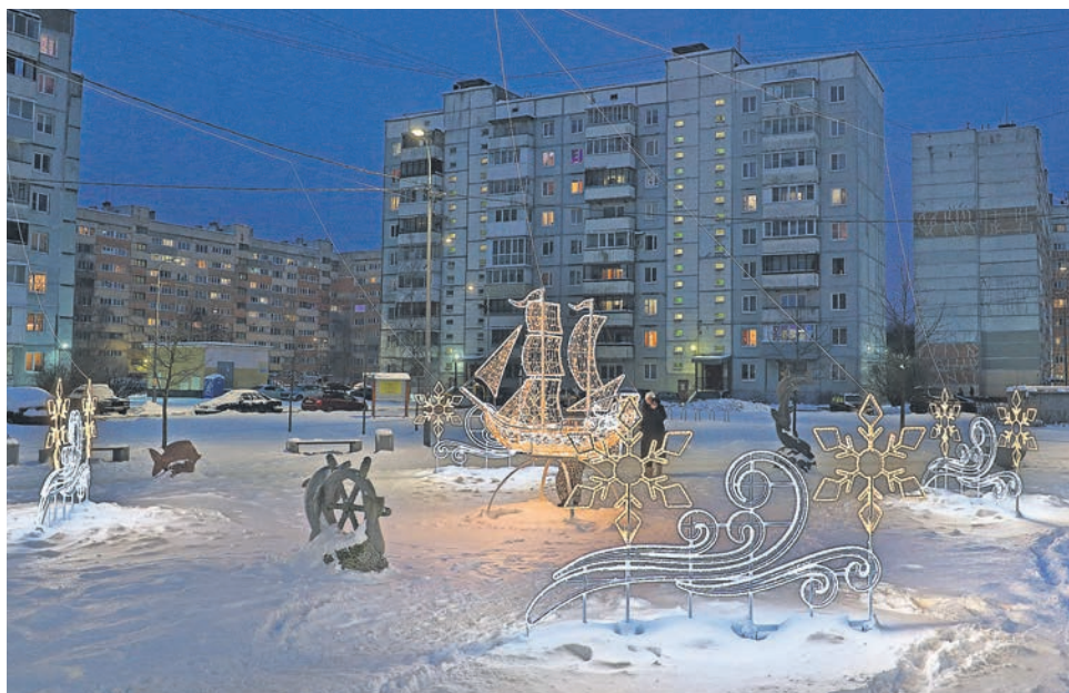
Ораниенбаумский пр., д. 45, к. 3

в патриотических акциях – 10,1 тыс. человек.