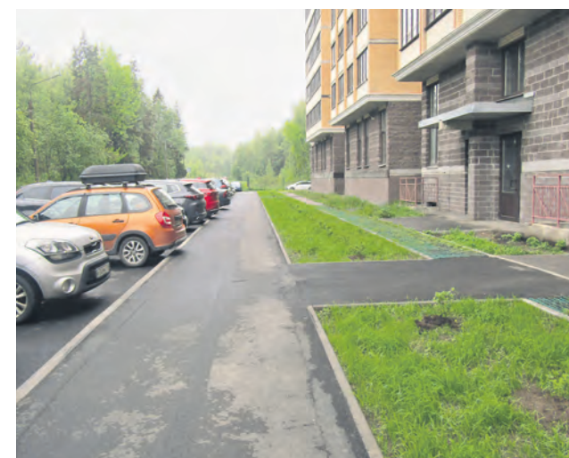
Михайловская ул., 51