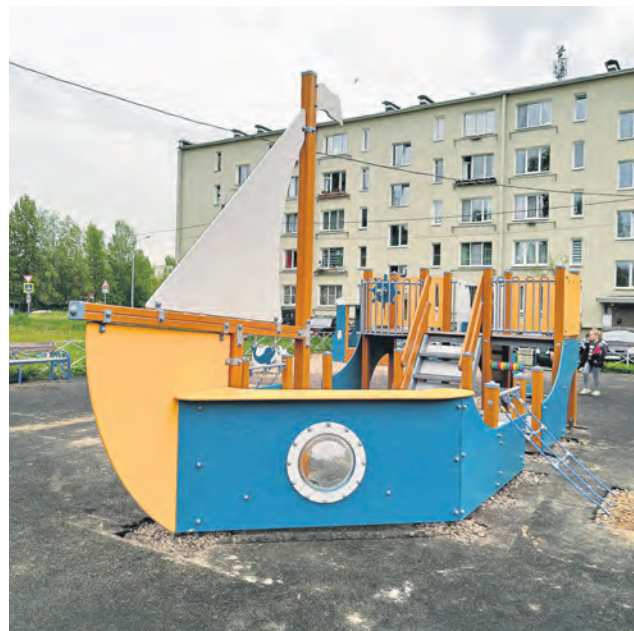
Новое оборудование на ул. Профсоюзная, 11

Лето — самая насыщенная пора для благоустройства. О новых его этапах расскажем в следующий раз. ■