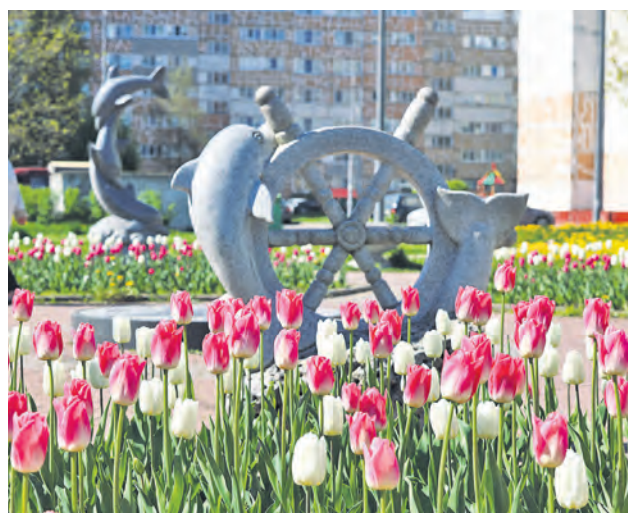
Ораниенбаумский пр., 43