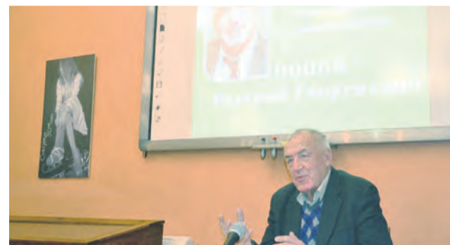
Председатель совета Союза писателей Санкт-Петербурга Валерий Георгиевич Попов