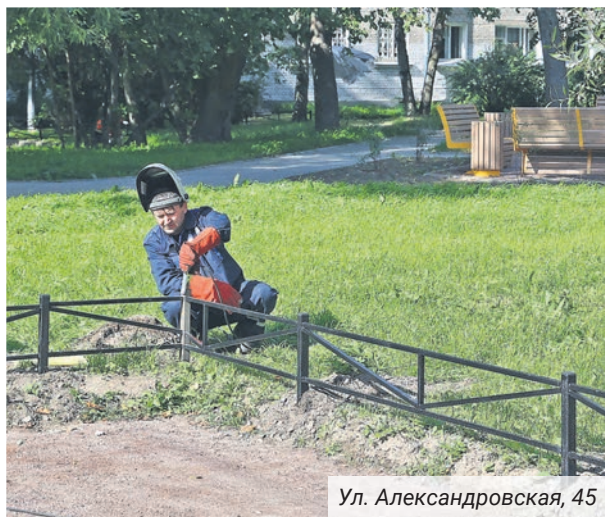
Ул. Александровская, 45

нием нового материала. Содержание и уборка дорог местного значения