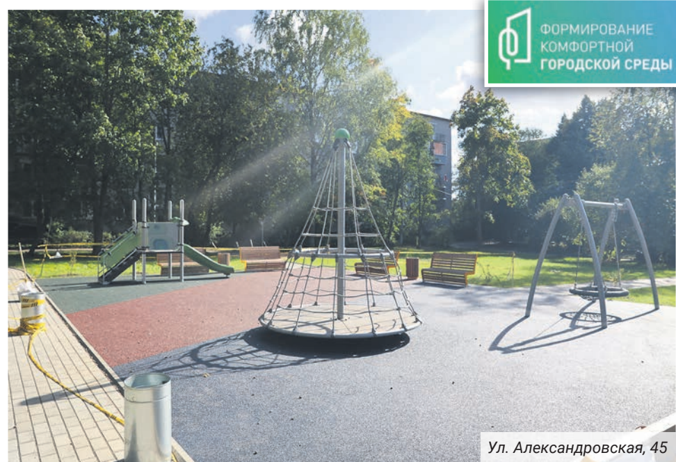
Ул. Александровская, 45

По обоим адресам смонтировано безопасное покрытие площадок, установлено игровое оборудование. Внутриквартальная территория на Александровской улице — самый крупный объект комплексного благоустройства по программе «Формирование комфортной городской среды», реализующийся в Ломоносове в этом году. Официально завершить работы должны до середины осени.