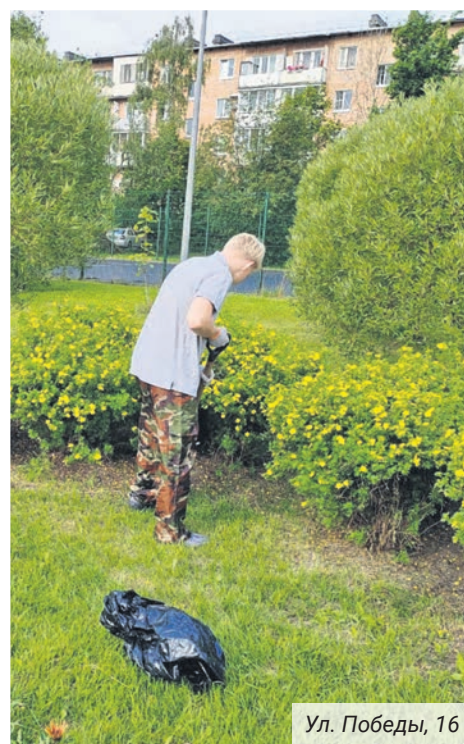
Ул. Победы, 16

Специалистами отдела благоустройства началась подготовка документации на выполнение работ по вопросам местного значения на будущий 2024 год. ■