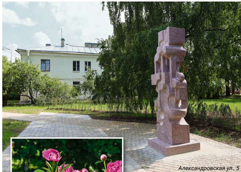
Александровская ул., 5

Завершено благоустройство с установкой детской площадки на улице Токарева, 18. Стартует мощение пешеходных дорожек на самом крупном объекте комплексного благоустройства в этом году – во дворе дома 45 на улице Александровская, предварительная разметка и планировка здесь выполнены. На очереди – площадка на улице Красная, где будет установлено детское игровое оборудование и проведено озеленение. ■