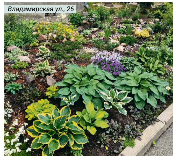
Владимирская ул., 26