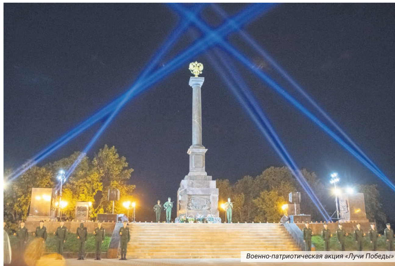
Военно-патриотическая акция «Лучи Победы»