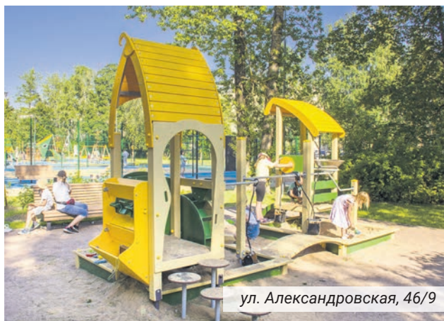
ул. Александровская, 46/9