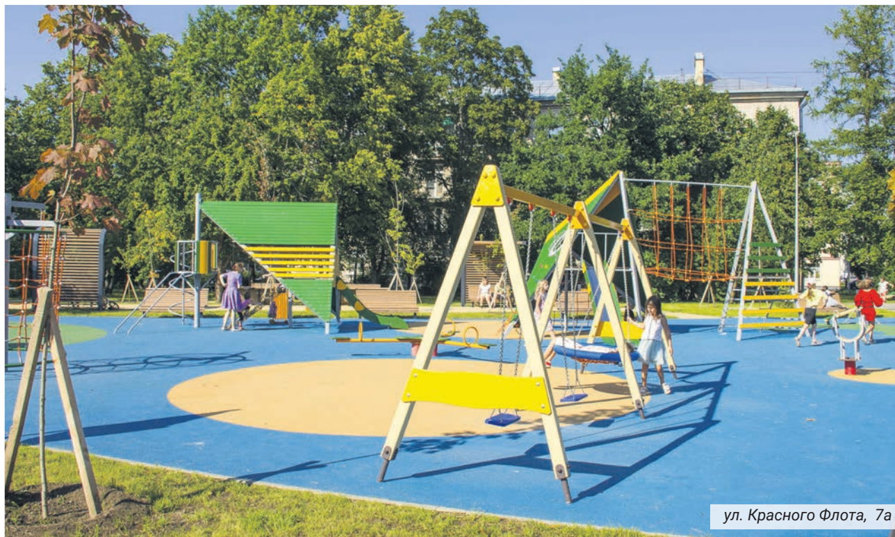
ул. Красного Флота, 7а