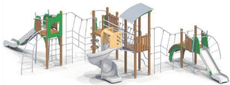
Детский игровой комплекс, планируемый к установке на ул. Токарева, 18А

В профильном отделе местной администрации к сезону практически готовы. Если погода позволит, то уже с 15 апреля планируют приступить к профилированию дорог с неусовершенствованным покрытием, а с 17 апреля — к ремонту асфальтового покрытия проездов на внутриквартальных территориях. Запланировано восстановить более 10 000 квадратных метров асфальтового покрытия, в том числе около 400 квадратных метров отремонтировать «картами». Подрядчик для проведения работ уже определен. А вот ремонт и замену искусственных неровностей на проездах планируют начать уже в летний сезон.