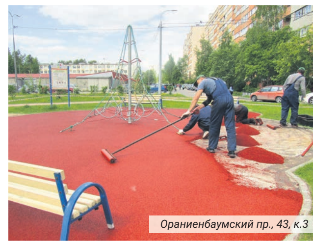
Ораниенбаумский пр., 43, к.3

В 2022 году капитально отремонтированы три детских площадки, в том числе двор «Катальная горка». Работы обошлись более чем в три миллиона рублей.