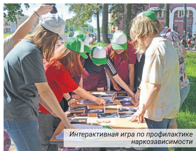
Интерактивная игра по профилактике наркозависимости

72 подростка в возрасте от 14 до 18 лет смогли принять участие в работе двух смен летних трудо-