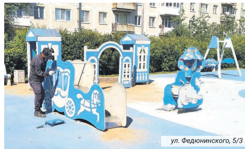
ул. Федюнинского, 5/3