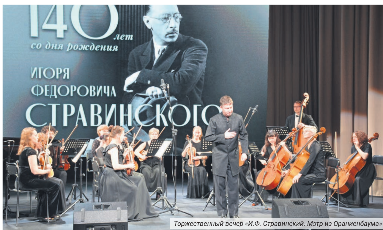
Торжественный вечер «И.Ф. Стравинский. Мэтр из Ораниенбаума»

После снятия эпидемиологических ограничений в 2022 году возобновилось проведение общегородских праздников. В традиционном народном гуля-