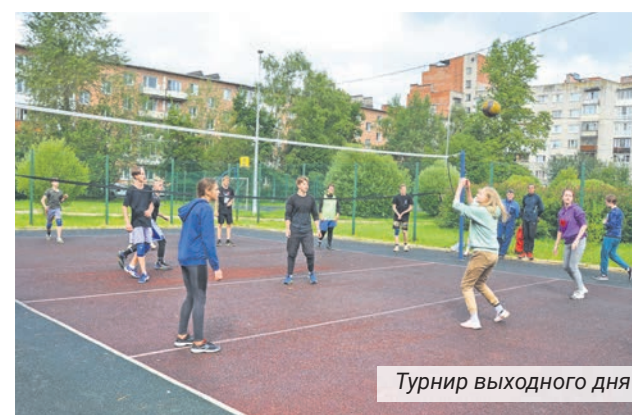
Турнир выходного дня

спортивно-массовых и физкультурно-оздоровительных мероприятий проведено в 2022.