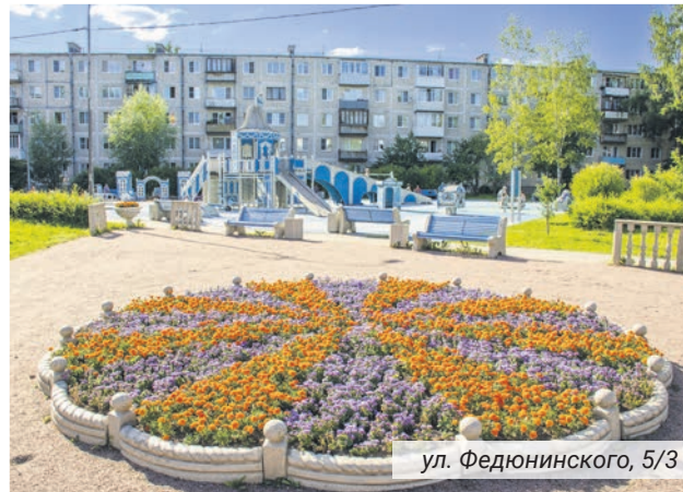
ул. Федюнинского, 5/3

устройства. Целевые программы составлялись с учётом пожеланий жителей муниципального образования и депутатов местного совета.