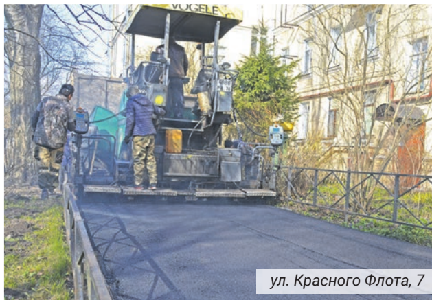
ул. Красного Флота, 7

Традиционно большая часть расходов муниципального бюджета направлена на сферу благо-