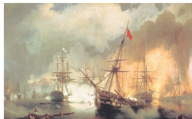
И. К. Айвазовский. «Морское сражение при Наварине»

«Свобода или смерть!» — прозвучало с помоста, и зал взорвался ликующими возгласами. Ещё бы, ведь этот лозунг оказался правильным ответом на вопрос о призыве национально-освободительного движения в Греции, который был задан в ходе интеллектуальной игры «Морская слава Ораниенбаума», организованной муниципальным образованием город Ломоносов.