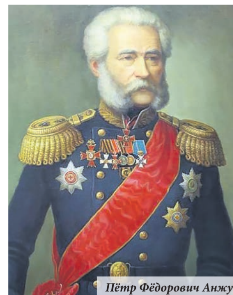
Пётр Фёдорович Анжу

Содействуя проведению Дня Наварина, муниципальное образование город Ломоносов способствует сохранению самобытных традиций, популяризации истории, под-