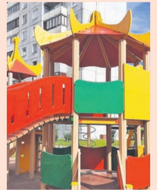
Ораниенбаумский пр., 49, к. 1

О том, как быстро летит время, можно судить по ремонту детских площадок. Вот, например, казалось бы — только вчера открывали первый масштабный игровой комплекс «Катальная горка» на улице Федюнинского. А уже ремонт успели сделать.