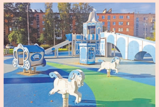
Ул. Федюнинского, 5/2

Завершён ремонт с добавлением нового материала улицы Киричная и асфальтового покрытия улиц Черникова и Пулемётчиков. Продолжается обследование аварийных и сухих деревьев на территории муниципального образования для получения порубочных талонов. Вырубки будут производиться в 4 квартале этого года. При этом, сухие и сломанные ветки и деревья, представляющие угрозу, устраняются по мере выявления. До 15 октября планируется провести новые посадки — так называемое компенсационное озеленение.