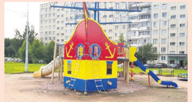
Ораниенбаумский пр., 21

«День солидарности в борьбе с терроризмом» приурочен к одной из самых страшных трагедий этого века — захвату заложников в школе №1 в Беслане, жертвами которой стали более 330 человек. 186 из них дети.