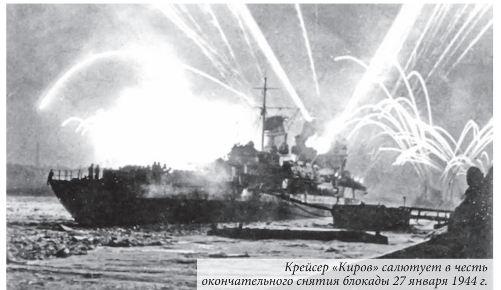
Крейсер «Киров» салютует в честь окончательного снятия блокады 27 января 1944 г.

Виктория Сярова, фото из книги «Ораниенбаумский плацдарм»