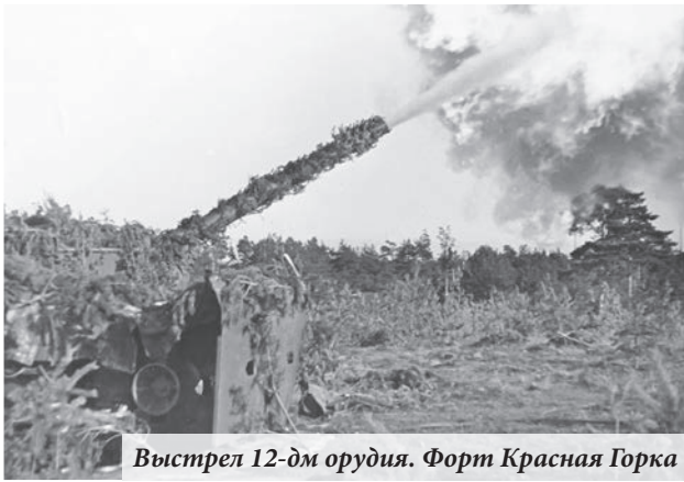
Выстрел 12-дм орудия. Форт Красная Горка