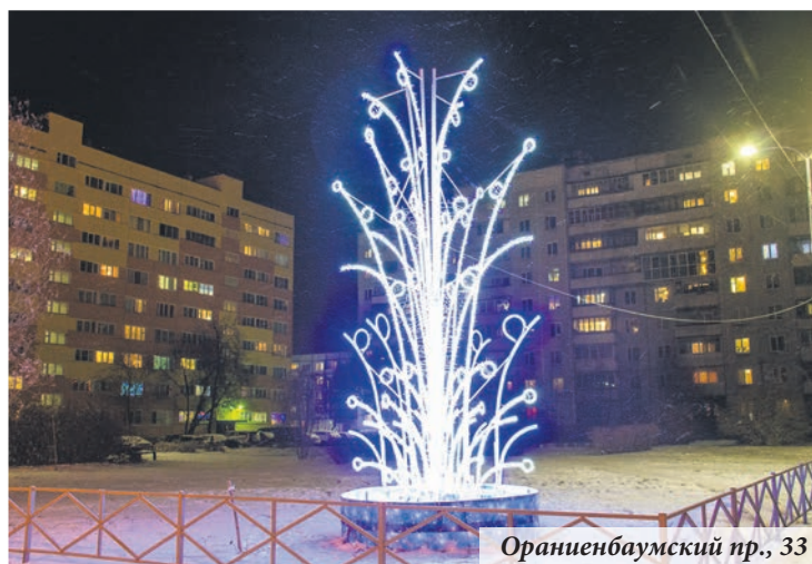
Ораниенбаумский пр., 33

Ломоносов вместе с Петербургом приступил к традиционным зимним хлопотам.