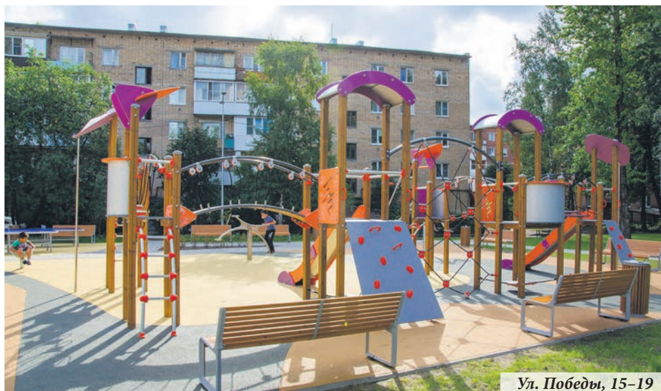
Ул. Победы, 15–19