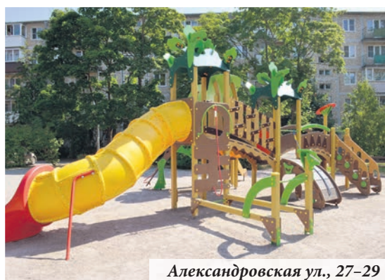
Александровская ул., 27–29

В уходящем году муниципальное образование город Ломоносов провело комплексное благоустройство внутриквартальной территории на улице Победы, 19 и 15. Такой проект преобразования, который охватывает единой концепцией сразу два двора, реализован нами впервые. Он реализован по программе «Формирование комфортной городской среды». Во дворах появилось необычное оборудование, например, качели для взрослых, тренажёры европейского уровня. По результатам общегородского смотра-конкурса комплексное благоустройство квар-