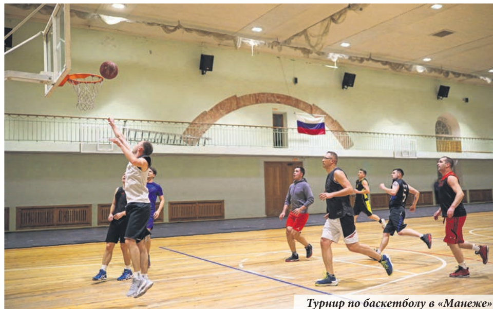
Турнир по баскетболу в «Манеже»

В течение всего года работали секции по баскетболу, волейболу, настольному теннису и общей физической подготовке на базе ФК «Манеж», на муниципальных спортивных площадках проходили занятия с инструкторами по скандинавской ходьбе, игре в финские городки и в шахматы.