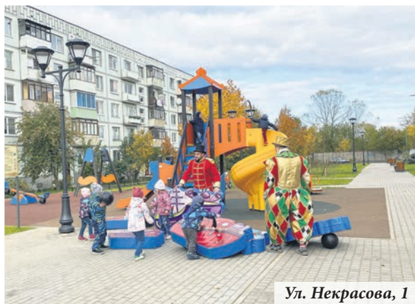
Ул. Некрасова, 1

«Детское оборудование, установленное к 300-летию города, приходит в негодность и требует ремонта или полного демонтажа. Установка нового оборудования, малых архитектурных форм, хозяйственно-бытового оборудования согласно новым правилам осуществляется только при наличии согласованного со всеми профильными комитетами проекта. Согласование проекта занимает