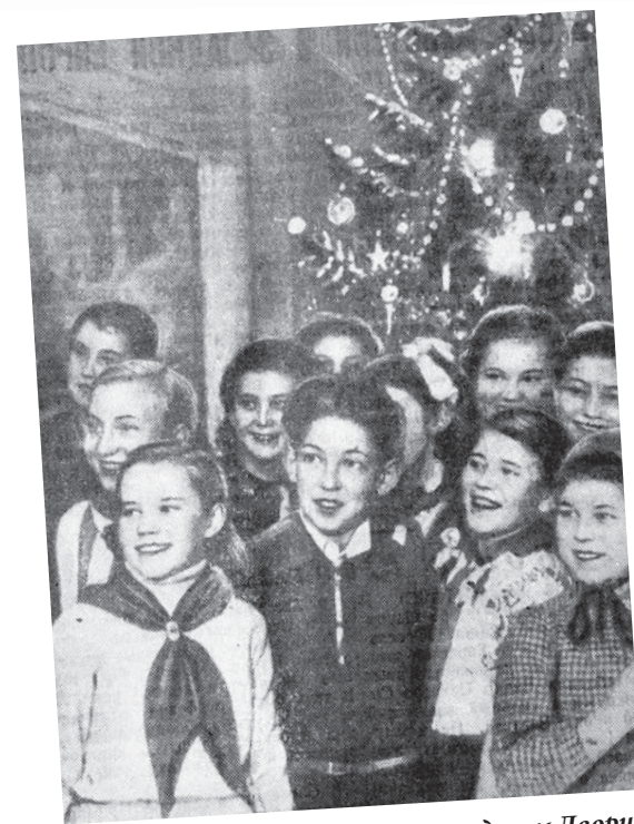
Новогодняя Ёлка в Ленинградском Дворце пионеров (фото из газеты «Ленинградская правда», 4 января 1945 года)