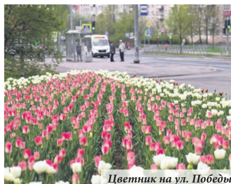
Цветник на ул. Победы