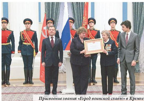
Присвоение звания «Город воинской славы» в Кремле

Сегодня в Российской Федерации почётным званием награждены 45 городов. Первым статус ГВС получил Белгород, а последним — Феодосия.