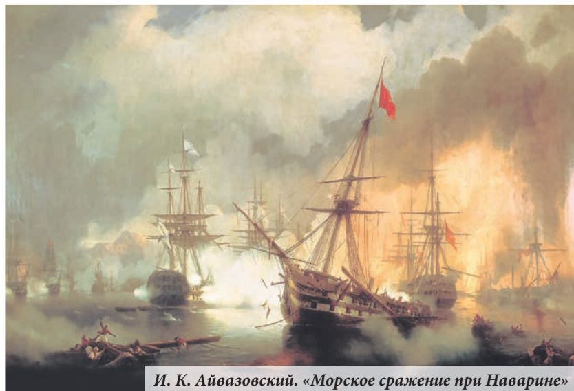
И. К. Айвазовский. «Морское сражение при Наварине»

Награждение победителей грамотами и призами состоится 3 ноября в 16.00 по адресу: г. Ломоносов, Дворцовый пр., д. 12/8, Ломоносовский городской Дом культуры, малый зал.