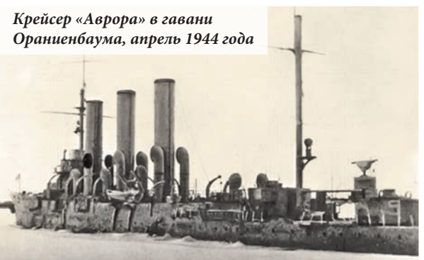
Крейсер «Аврора» в гавани Ораниенбаума, апрель 1944 года

По материалам книги «Ораниенбаумский плацдарм»