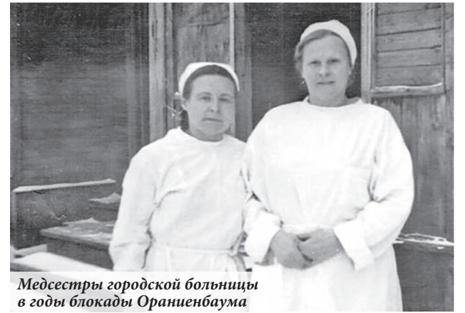
Медсестры городской больницы в годы блокады Ораниенбаума

Специалисты санитарно-эпидемиологической лаборатории флота разработали несколько образцов простейших дезинсекторов, в том числе антипаразитарный препарат «К», предназначенный для борьбы с завшивленностью. Этим препаратом пропитывалось бельё военнослужащих, подвергалась обработке одежда гражданского населения. А мыло «К»