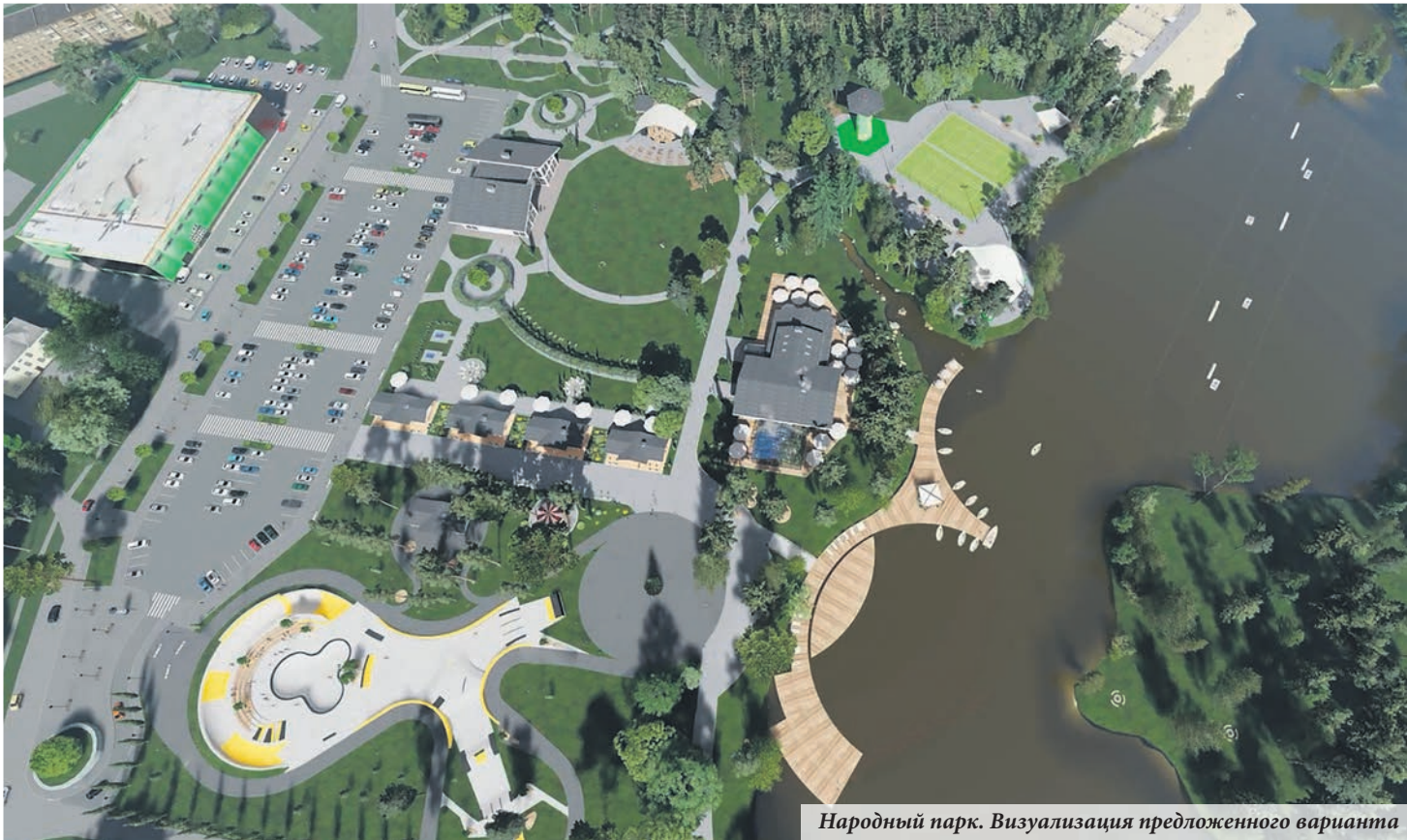
Народный парк. Визуализация предложенного варианта