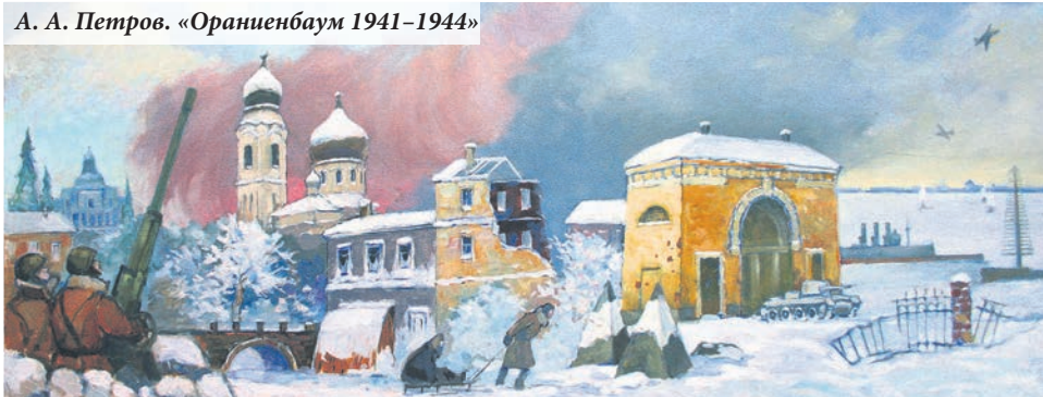
А. А. Петров. «Ораниенбаум 1941–1944»

Начало блокады вспоминали 8 сентября на мемориале «Малая Пискарёвка». У вечного огня минутой молчания почтили память павших защитников и мирных жителей города. К памятнику возложили венки и цветы. Здесь, в Красной Слободе, в братской могиле похоронены 5 тысяч человек — жертв военного и блокадного лихолетья.