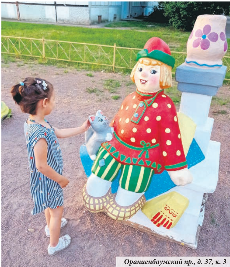
Ораниенбаумский пр., д. 37, к. 3

Емеля на печи вернулся в свой двор, а водителей притормозили особые «полицейские» — так началось лето в сфере муниципального благоустройства.