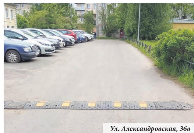
Ул. Александровская, 36в