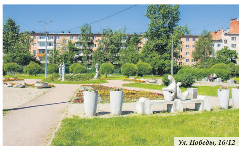
Ул. Победы, 16/12