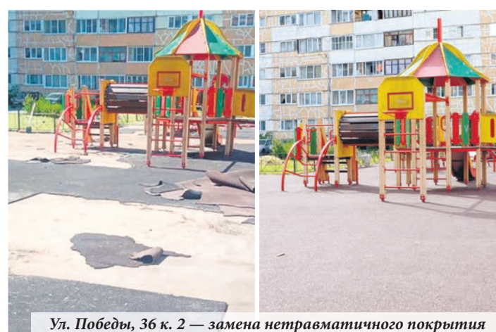
Ул. Победы, 36 к. 2 — замена нетравматичного покрытия