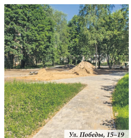
Ул. Победы, 15–19

Подрядчики местной администрации откосили в прямом смысле этого слова. Завершён первый из пяти запланированных покосов травы. Также закрыт посадочный сезон, и дворы украсили цветы «летники». Следующие посадки будут производиться уже осенью, а в этом сезоне будет осуществляться уход за зелёными насаждениями.