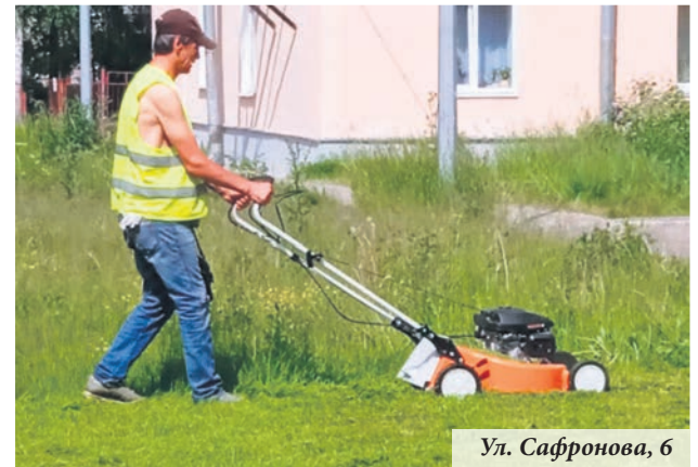
Ул. Сафронова, 6