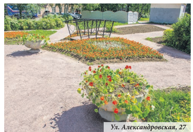
Ул. Александровская, 27

Неровности на внутриквартальных проездах бывают разные: одни устраняют, а другие создают. И всё это — по заказу местной администрации. В июне подрядчик завершил установку и ремонт «лежащих полицейских» по шести адресам. Всего уложено 21 метр искусственных неровностей. Работы выполнялись в рамках реализации вопроса местного значения «Участие в реализации мер по профилактике дорожно-транспортного травматизма на территории муниципального образования».