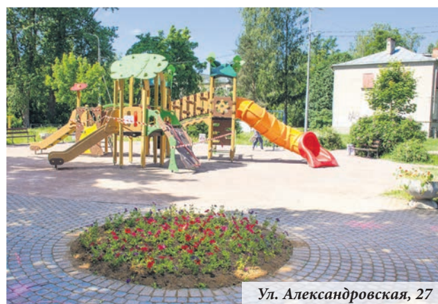
Ул. Александровская, 27