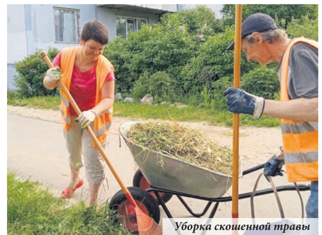
Уборка скошенной травы

Основательный ремонт продолжается во дворах на улицах Победы, 15–19 и Некрасова, 1. Здесь уже приступили к земляным работам, а на самом большом объекте капитального благоустройства вырисовываются будущие очертания газонов и тропинок. Начался и ремонт оснований детских площадок: на улице Победы, 36 корпус 2 меняют нетравматичное покрытие. Под качелями по нескольким адресам в скором времени появятся специальные резиновые коврики.