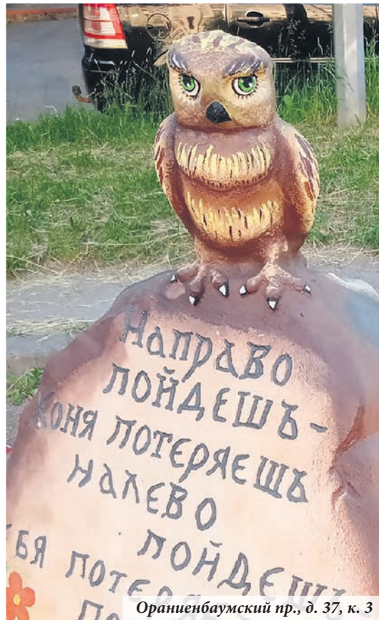
Ораниенбаумский пр., д. 37, к. 3