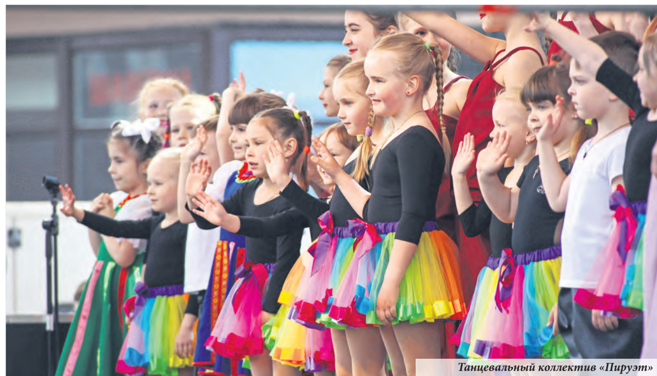
Танцевальный коллектив «Пируэт»