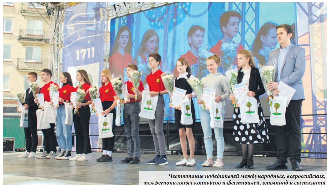
Чествование победителей международных, всероссийских, межрегиональных конкурсов и фестивалей, олимпиад и состязаний

Насколько талантливые люди живут в нашем городе продемонстрировал концерт, включавший вы-