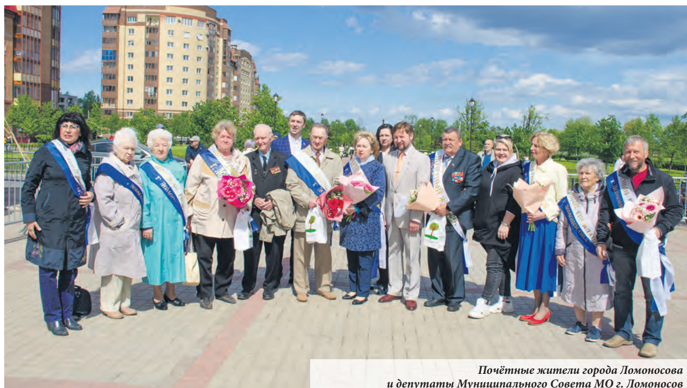
Почётные жители города Ломоносова и депутаты Муниципального Совета МО г. Ломоносов

«Наш город - это наш дом. Давайте пожелаем сегодня нашему любимому дому процветания, благополучия, новых красивых дворов, комфортной обстановки. Пусть наши дети будут счастливы, а пожилые люди будут окружены заботой и вниманием. Давайте любить