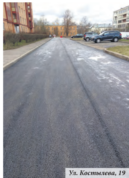
Ул. Костылева, 19

асфальтового покрытия на внутриквартальных территориях муниципального образования по адресам: ул. Александровская, 32а, ул. Скуридина, 2, ул. Победы, 9, ул. Швейцарская, 1, ул. Костылева, 19.