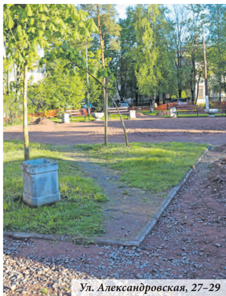
Ул. Александровская, 27–29

В рамках реализации приоритетного проекта «Формирование комфортной городской среды» закончен ремонт