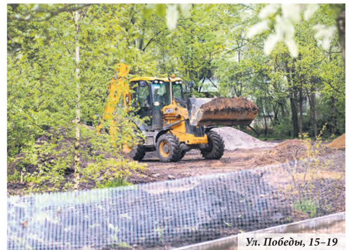
Ул. Победы, 15–19

Подрядчик приступил к ремонту двора на Александровской улице, 27–29. До 30 июня здесь должны отремонтировать дорожки с отсевом, площадки, очистить тротуарную плитку, привести в порядок декоративный мостик и установить детский игровой город и песочницу.