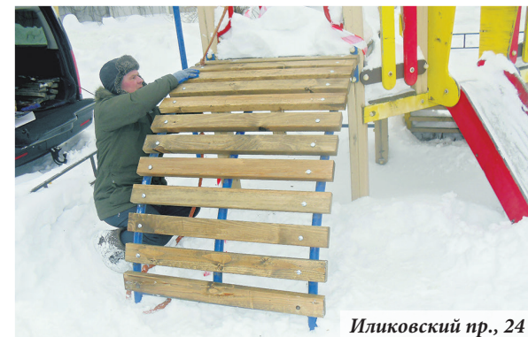
Иликовский пр., 24

В отделе благоустройства местной администрации к началу сезона готовы: контракты на комплексное благоустройство квартала в рамках улиц Победы и Швейцарская в стадии заключения, подготовлены документы для размещения контракта по ремонту комплексного благоустройства двора на улице Александровская, 27–29. Здесь планируют обновить пешеход-