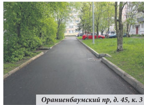
Ораниенбаумский пр, д. 45, к. 3

Первые корректировки появились уже в январе 2020 года: изменение законодательства переквалифицировало подведомственные муниципальному образованию территории из «внутридворовых» во «внутриквартальные», территории, ограниченные многоквартирными домами. Из-за этого из «муниципальной карты