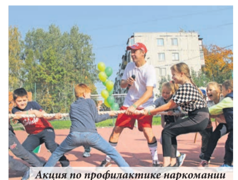
Акция по профилактике наркомании

Мы провели многие культурные, патриотические, обучающие и профилактические мероприятия, но не в традиционном виде, а в дистанционном формате. И надо отметить, что число их участников возросло в разы! На конкурсы, фестивали, проводимые