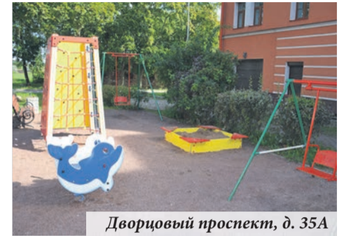
Дворцовый проспект, д. 35А

отделом культуры и молодёжной политики, приходили сотни работ. Ежегодный фестиваль «Родник жизни», посвящённый Дню матери, собрал пятьсот конкурсантов! Обучающие семинары по действиям в чрезвычайных ситуациях, «Школу ТСЖ», «Школу предпринимателей» посмотрели сотни человек, тогда как в «очном формате» число участников исчислялось десятками. Это справедливо и для семинаров на тему профилактики зависимостей — если ранее они проводились для ограниченного числа молодых людей, то в этом году стали доступны всем желающим. Онлайн формат оказался актуальным, востребованным, и в дальнейшем мы будем продолжать