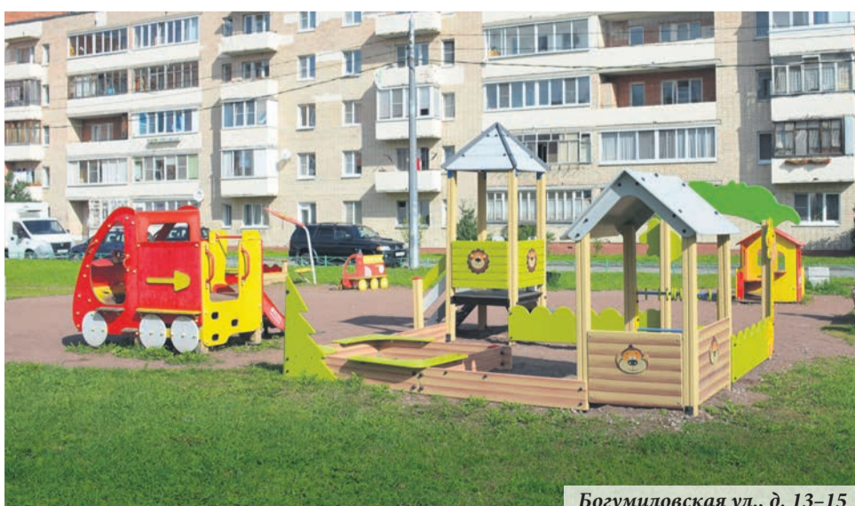
Богумиловская ул., д. 13-15