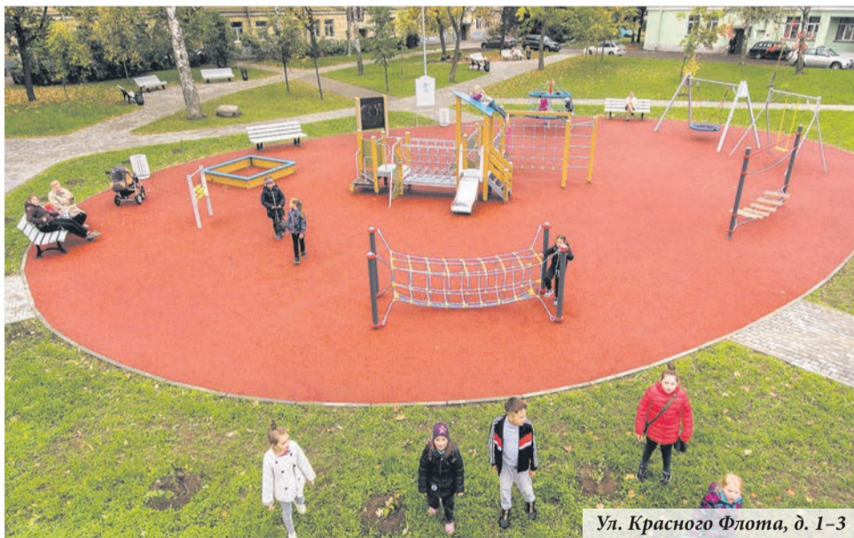
Ул. Красного Флота, д. 1-3