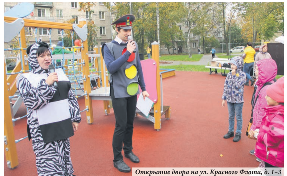
Открытие двора на ул. Красного Флота, д. 1-3

детского игрового оборудования и детских площадок. Причём не только запланированного, но и по просьбам жителей. Мы выполнили комплексное благоустройство двора на улице Красного Флота, 1-3 по программе «Формирование комфортной городской среды». Восстановили скульптуру «Наблюдатель» — вернув на место Красную ворону. Несмотря на все опасения, осенью в доходный источник местного бюджета начались поступления с налогов предпринимателей, благодаря чему мы смогли выполнить просьбы жителей по установке скамеек, урн, дополнительного ремонта детских площадок; заключить контракт на поставку новогодних подарков для маленьких жителей Ломоносова от Деда Мороза.