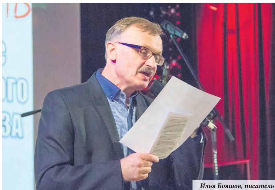
Илья Бояшов, писатель