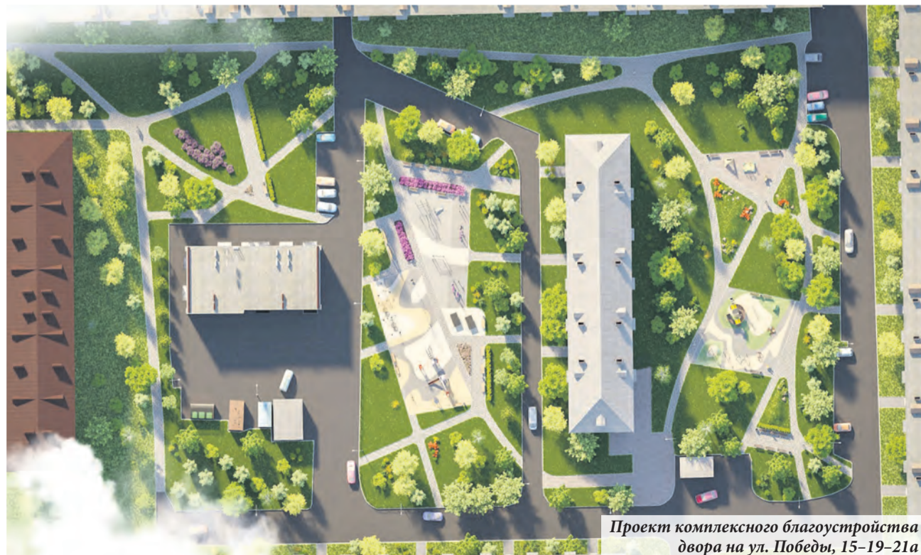
Проект комплексного благоустройства двора на ул. Победы, 15-19-21а

Произведён ремонт 20 урн — покраска и замена вкладышей — во дворах на Ораниенбаумском проспекте, д. 23, улице Скуридина, д. 6 и Дворцовом проспекте, д. 40.