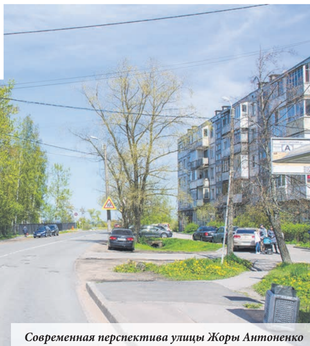
Современная перспектива улицы Жоры Антоненко