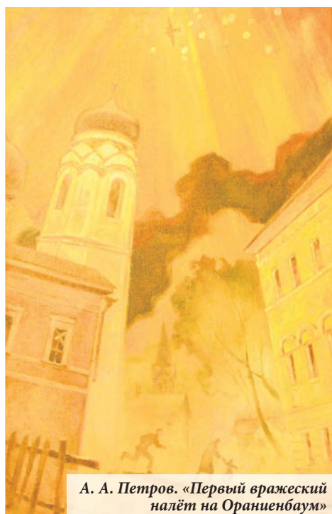
А. А. Петров. «Первый вражеский налёт на Ораниенбаум»

Ораниенбаум сыграл в истории Блокады особую роль. Ораниенбаумский пятачок не был захвачен врагом. Он оказался в двойном кольце блокады. Пайка хлеба — меньше ленинградской. Артобстрелы — интенсивнее. Стратегически важная территория — ключ к Кронштадту, к Балтийскому флоту. 900 дней держался Ленинград, не сдавался Ораниенбаумский плацдарм. И именно он стал отправной точкой освободительной операции «Январский гром», положившей