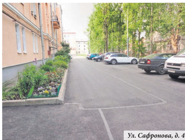
Ул. Сафронова, д. 4

Выполнена просьба жителей Ломоносова по ремонту газонного ограждения на улице 1-я Нижняя, дом 5. После поступивших обращений в отделе городского хозяйства и потребительского рынка указанный адрес включили в перспективный план работ на этот год и, как только появилась возможность — возникла экономия при заключении контракта — провели работы. Теперь вместо утраченного красуется новое, покрашенное ограждение.