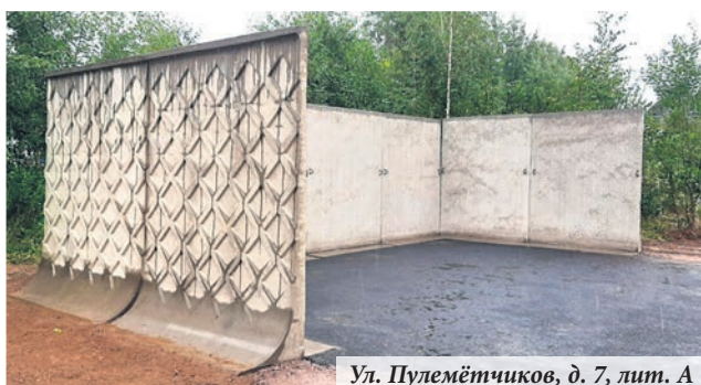
Ул. Пулемётчиков, д. 7, лит. А

В Кронколонии по заказу местной администрации оборудовали контейнерную площадку. Муниципальное образование город Ломоносов воспользовалось полномочием для решения наболевшей проблемы: жители жаловались на плохой подъезд к контейнерной площадке на улице Токарева. Но участок, где установлены контейнеры, находится в кадастре и местное самоуправление не может проводить здесь никакие работы. Поэтому, совместно с управляющей компанией, обслуживающей дома, было решено оборудовать новое место сбора отходов, на улице Пулемётчиков у дома № 7 лит. А. Работы были завершены в начале сентября. К новой площадке обустроен подъезд.