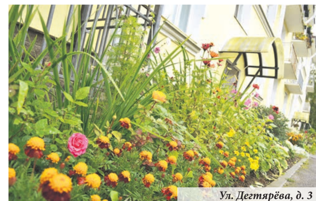
Ул. Дегтярёва, д. 3

Ежедневное признание от горожан получают ломоносовцы, создающие цветочную феерию в своих дворах. В этом году ещё два цветника были представлены к награждению почётным знаком «За заботу о красоте города»: на улице Костылева, 12 и улице Дегтярёва, 3. Конкурс не муниципальный, кандидатов выдвигает администрация района, а окончательное решение принимает профильный Комитет Правительства Санкт-Петербурга, но мы все «держим кулачки» за наших жителей.