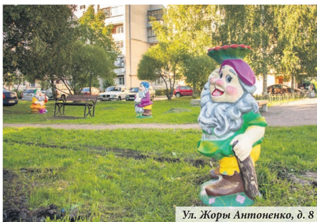
Ул. Жоры Антоненко, д. 8

Во двор на улице Жоры Антоненко, 8 вернулась сказка: 14 сентября здесь установили фигуры Белоснежки и семи гномов. Сказочные персонажи «уезжали» на реставрацию: их отшлифовали, покрасили и покрыли лаком.