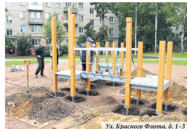
Ул. Красного Флота, д. 1–3

к примеру, планируется обустройство детского игрового комплекса, игровой панели «крестики-нолики», канатного перехода, песочницы, доски для рисования мелками. На спортивной площадке будут установлены два теннисных стола, комплекс турников, рукоходы, разновысотные брусья и тренажеры. Будут оформлены зоны отдыха со скамейками, созданы цветники-рокарии, посажены 30 деревьев и кустов. Площадь газонов составит почти 4 тысячи квадратных метров. По просьбам жителей во дворе будут оборудованы две сушилки для белья. Работы ведутся в рамках приоритетного проекта «Формирование комфортной городской среды» и должны быть завершены к 15 октября.