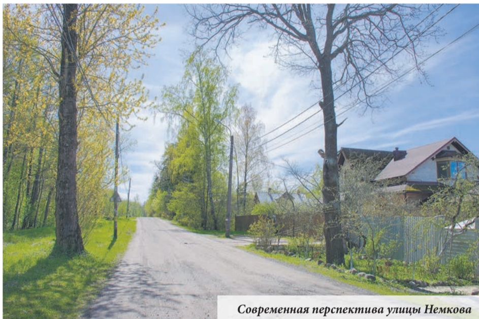
Современная перспектива улицы Немкова