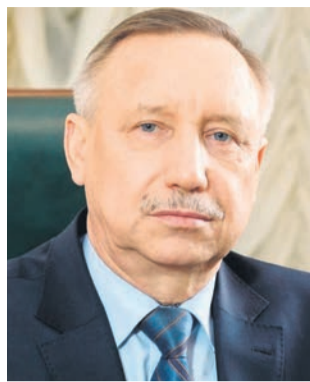
Александр БЕГЛОВ, губернатор Санкт-Петербурга