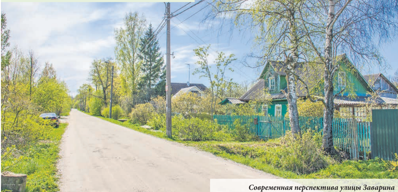
Современная перспектива улицы Заварина

По материалам Краеведческого музея г. Ломоносова