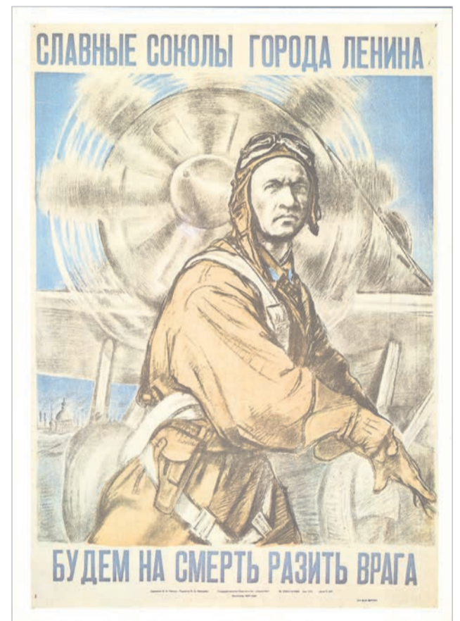
Плакат. Корнилов П., Пинчук В. Б. Ленинград. 1943 год

16 июля 1944 года в составе экипажа И. Н. Пономаренко недалеко от Котки участвовал в ликвидации «Ниобе», крупнейшего германского боевого корабля, самостоятельно потопленного советской авиацией в ходе Великой Отечественной войны. Вначале штурмовики атаковали зенитные средства врага. Затем