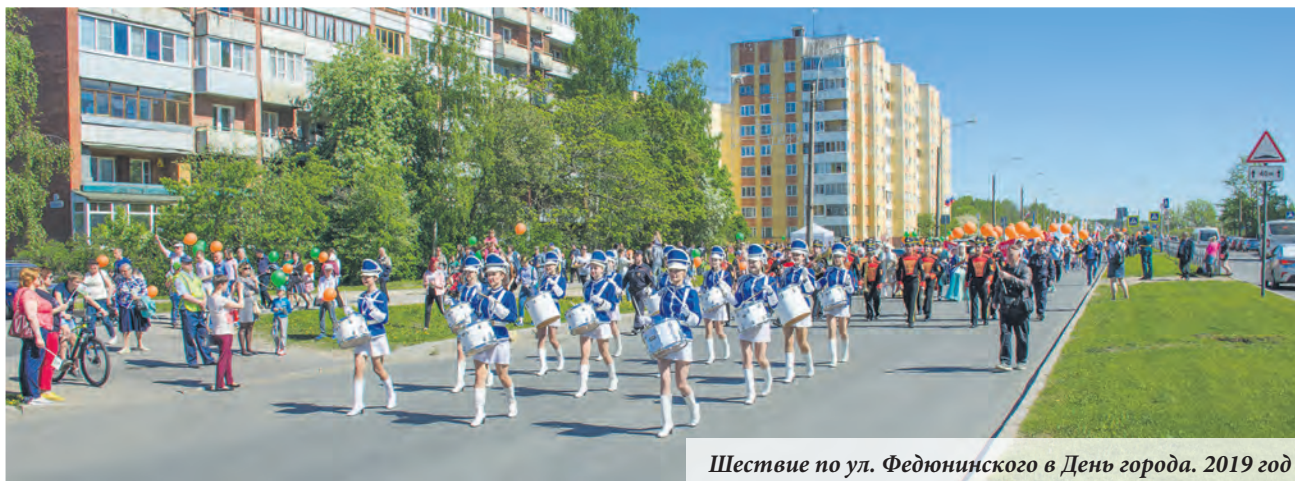
Шествие по ул. Федюнинского в День города. 2019 год