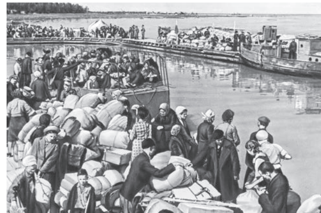
Эвакуация населения.