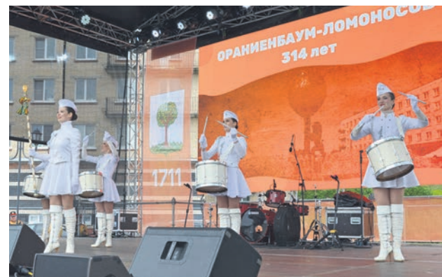
День города Ломоносова