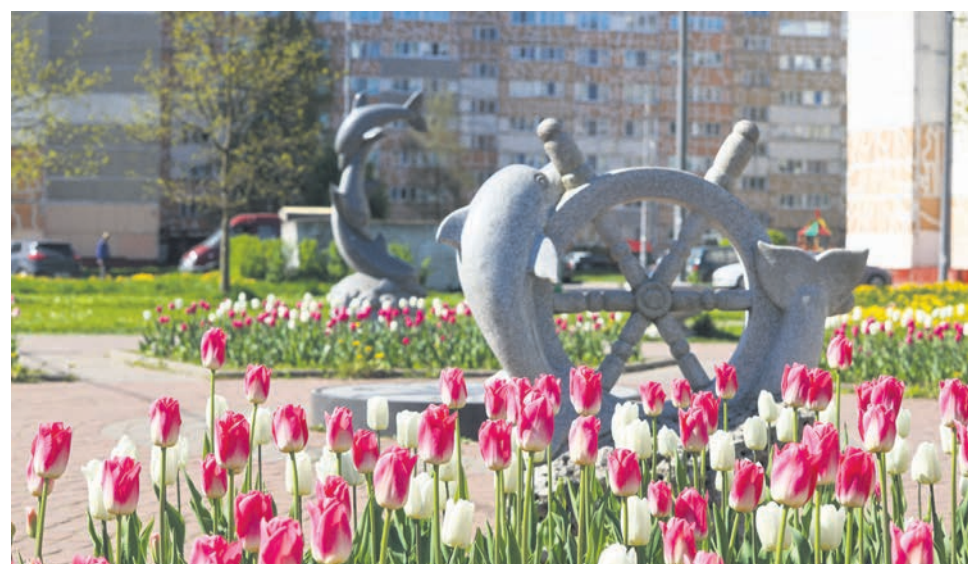
Ораниенбаумский пр., д. 45 к.3