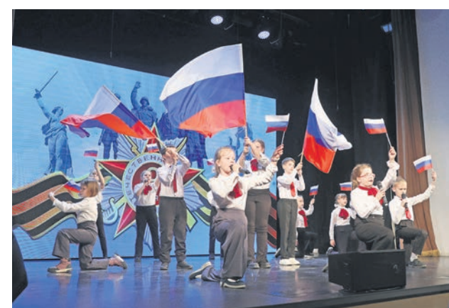
Фестиваль им. Героя РФ М. Ю. Малофеева