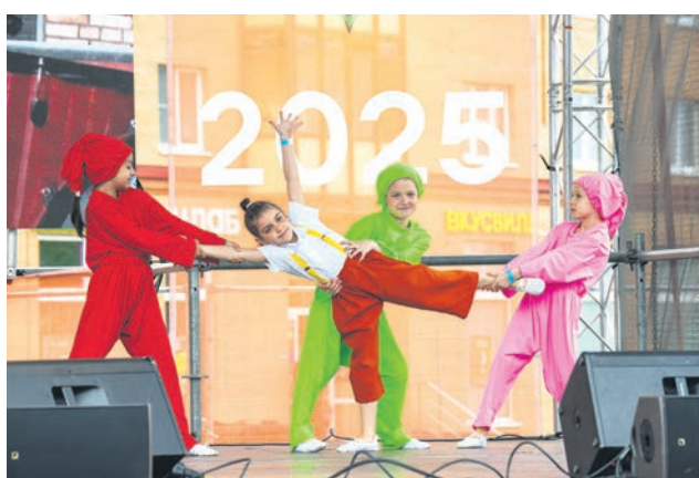
Гала-концерт фестиваля «Весенний калейдоскоп»