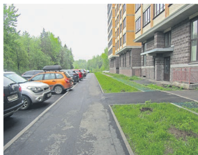
Михайловская ул., д. 51

32 818 цветов, 657 кустарников и 29 деревьев высажено на территории Ломоносова в 2025 году.