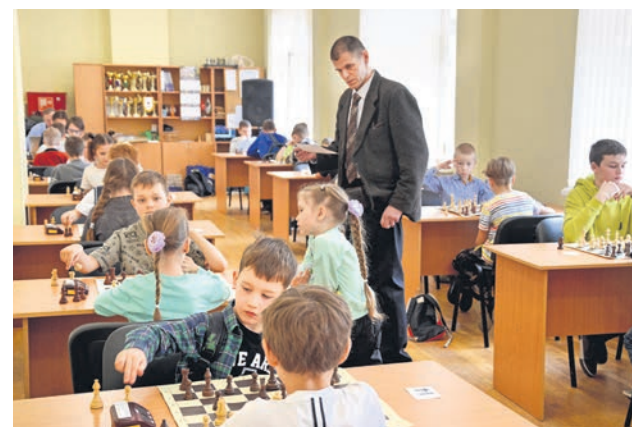
Турнир по шахматам

Военно-патриотическое воспитание — одно из направлений деятельности муниципальной власти. А в Год защитника Отечества и юбилей Великой Победы ему уделяли особое внимание. Местной администрацией проведено 27 военно-патриотических мероприятий, в которых приняли участие 10 000 человек. МКУ «Информационный центр» по заказу местной администрации МО г. Ломоносов выпустило книгу «Блокада в Ораниенбауме», альбом «Династия Грейгов на службе России».