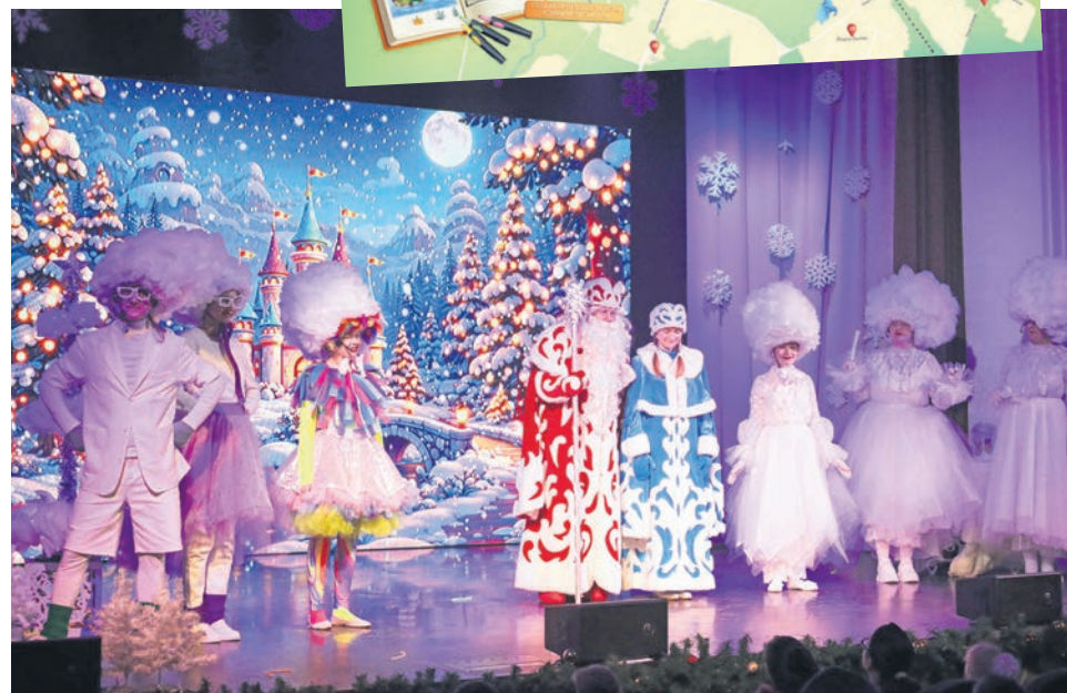
Новогодний спектакль для детей