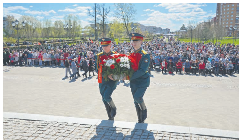
День Победы в Ломоносове