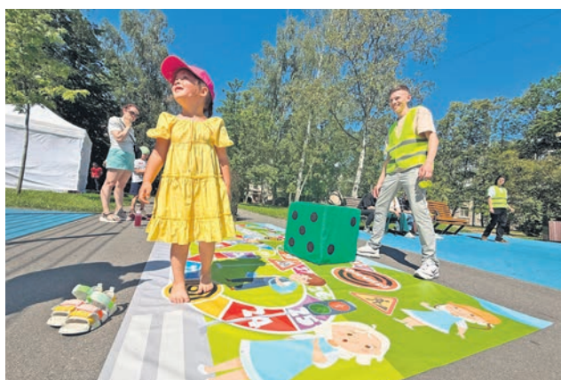
Праздник двора «Красный, жёлтый, зелёный»