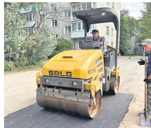
Красноармейская ул., д. 37