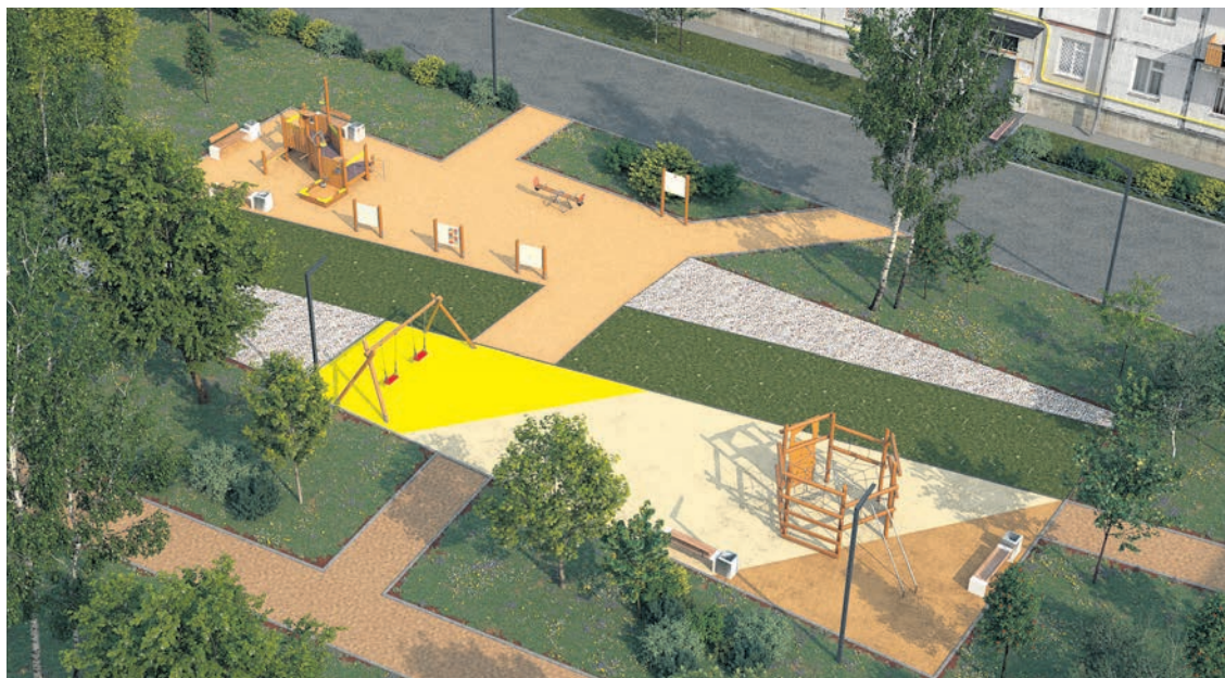
Проект благоустройства внутридворовой территории по адресу Александровская улица, 20–22

— В начале января издано постановление Правительства Санкт-Петербурга об утверждении программы «Петербургские дворы» на 2026 год, благодаря которой нам выделяются средства на реализацию трёх проектов комплексного благоустройства внутриквартальных территорий и дополнительного асфальтирования внутридворовых проездов. То есть, помимо запланированного нами благоустройства двора на улице Костылева, 16, мы сделаем ещё три новых проекта.