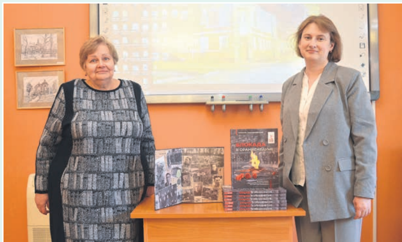
Автор-составитель В. М. Игнатенко и дизайнер книги М. А. Литвинова

Экземпляры «Блокады в Ораниенбауме» войдут в число подарков жителям нашего города, а также поступят в библиотеку Ломоносова. ■