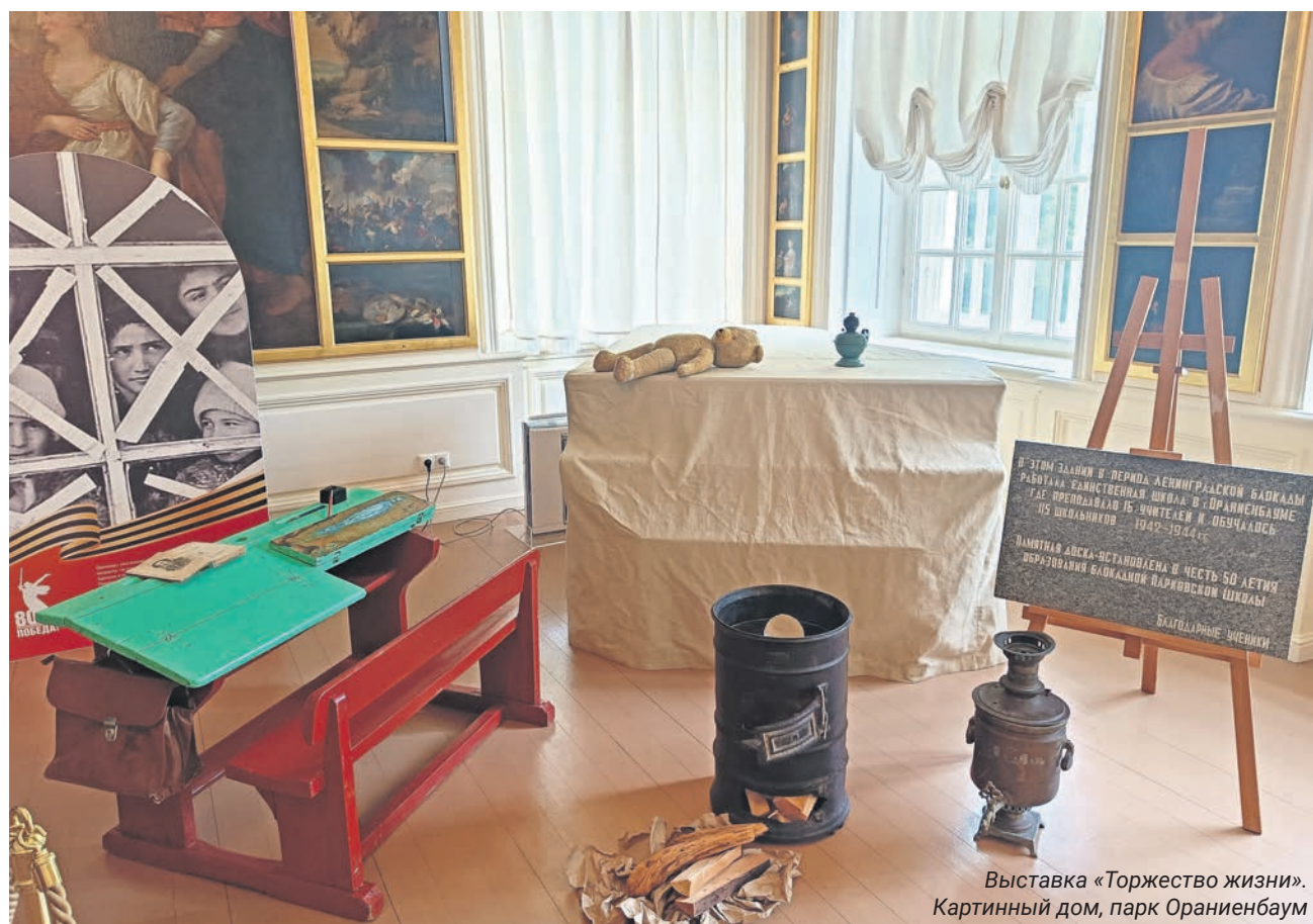
Выставка «Торжество жизни». Картинный дом, парк Ораниенбаум