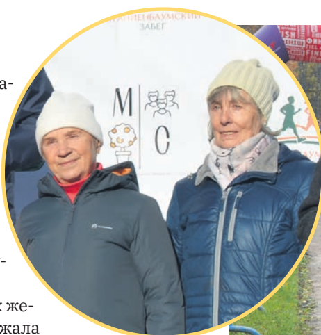
Олимпийские чемпионки Мухачёва Любовь, Казанкина Татьяна

В уверенности, что из юных участников забега при их желании обязательно вырастут чемпионы, коллегу поддержала олимпийская чемпионка по лыжным гонкам, заслуженный мастер спорта СССР Любовь Алексеевна Мухачёва. Спортсменка отдельно отметила, что пробежать кросс по классным парковым дорожкам — это настоящее удовольствие.