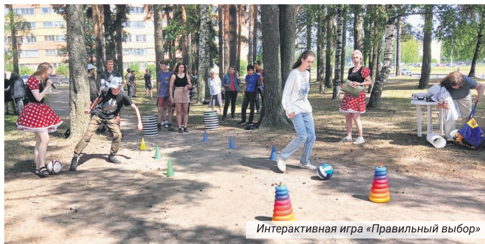
Интерактивная игра «Правильный выбор»

За 2023 год учреждением разработано, напечатано и распространено