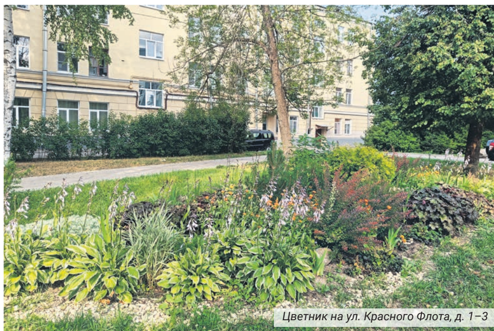
Цветник на ул. Красного Флота, д. 1–3