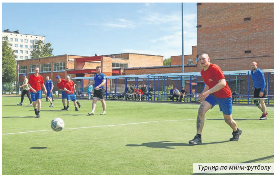
Турнир по мини-футболу

Отчёт о проделанной в 2023 году муниципальным образованием работе и исполнении бюджета был принят единогласно. ■