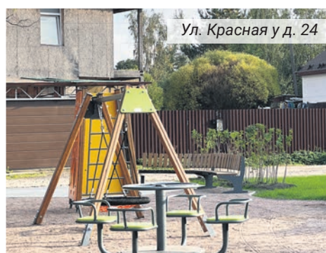
Ул. Красная уд. 24

чие полицейские». Всего было установлено 28 метров «искусственных дорожных неровностей».