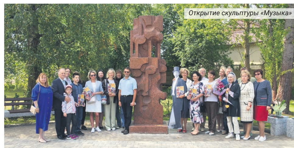
Открытие скульптуры «Музыка»