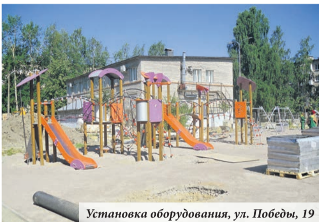
Установка оборудования, ул. Победы, 19

8 июля восточные славяне выходили на первый покос. А в Ломоносове первый покос уже завершён, и в самом разгаре второй — на внутриквартальных территориях и на обочинах дорог местного значения.