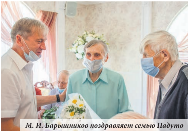
М. И. Барышников поздравляет семью Падуту