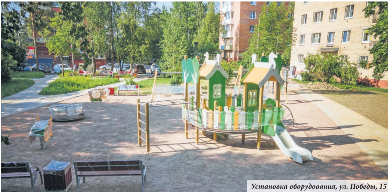
Установка оборудования, ул. Победы, 15