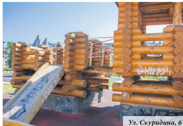
Ул. Скуридина, 6

А сейчас в отделе благоустройства приступили к работе над проектом бюджета будущего года.