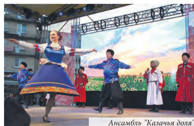
Ансамбль "Казачья доля"