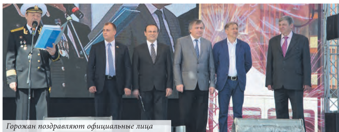
Горожан поздравляют официальные лица