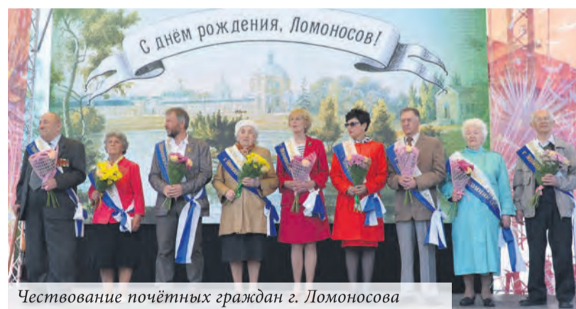
Чествование почётных граждан г. Ломоносова