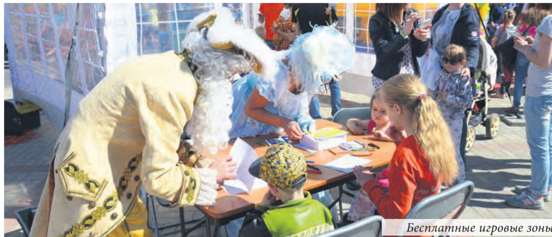
Бесплатные игровые зоны