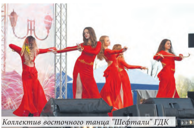
Коллектив восточного танца "Шефтали" ГДК