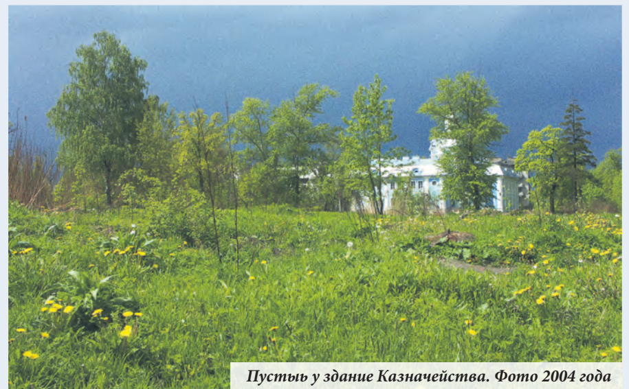
Пустырь у здание Казначейства. Фото 2004 года