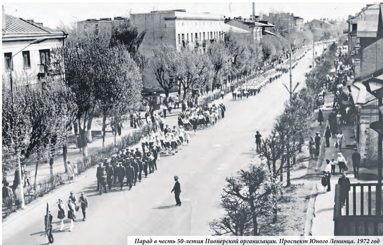
Парад в честь 50-летия Пионерской организации. Проспект Юного Ленинца. 1972 год