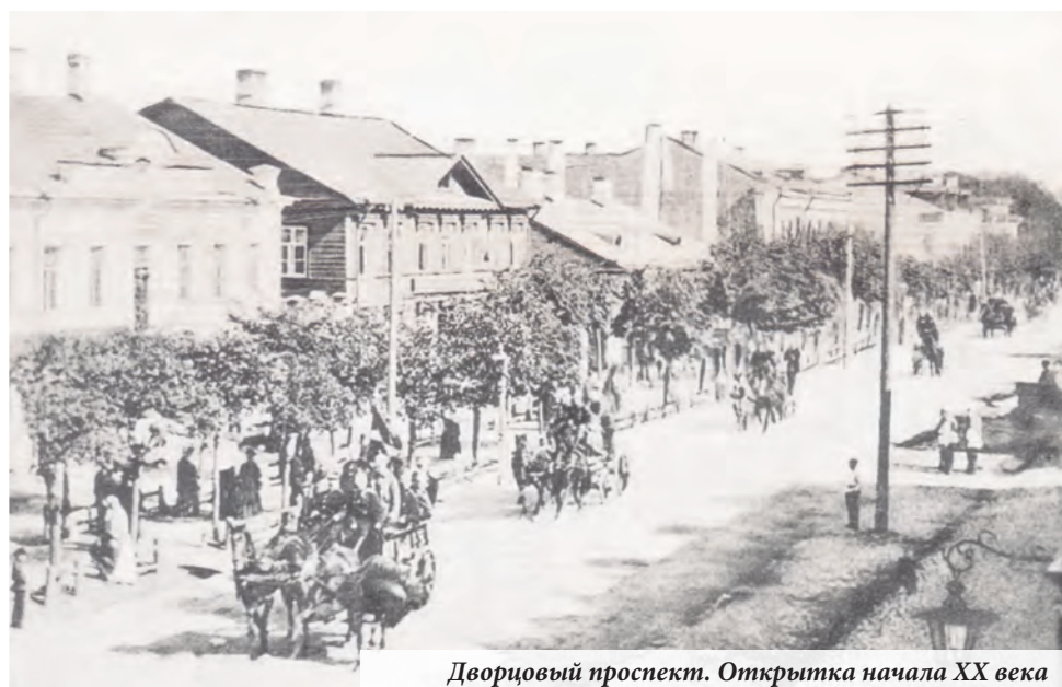
Дворцовый проспект. Открытка начала XX века