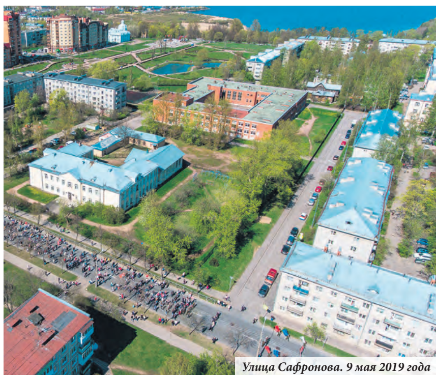
Улица Сафронова. 9 мая 2019 года

По материалам Краеведческого музея г. Ломоносова, фото Краеведческого музея г. Ломоносова и МКУ «Информационный центр»