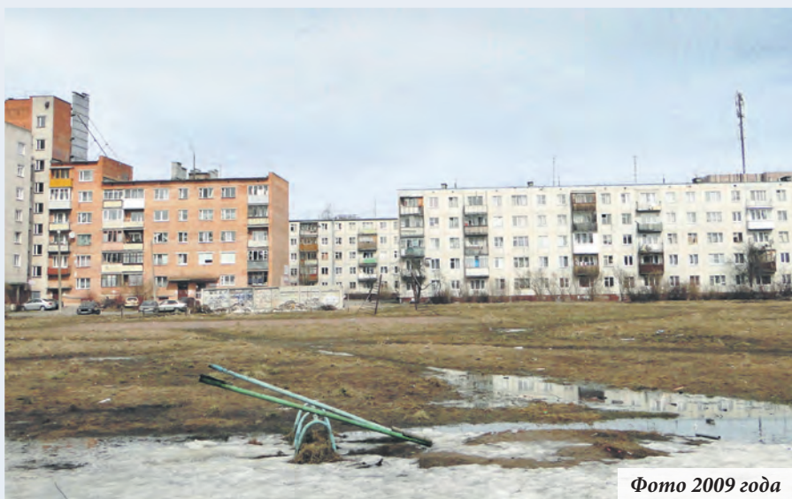
Фото 2009 года

на легендарном пустыре, а сегодня эта территория — гордость и любимое место прогулок горожан. В 2011 году Ломоносов получил почётное звание Российской Федерации «Город воинской славы», а спустя несколько лет в честь этого события была воздвигнута стела, украсившая и сквер, и въезд в город.